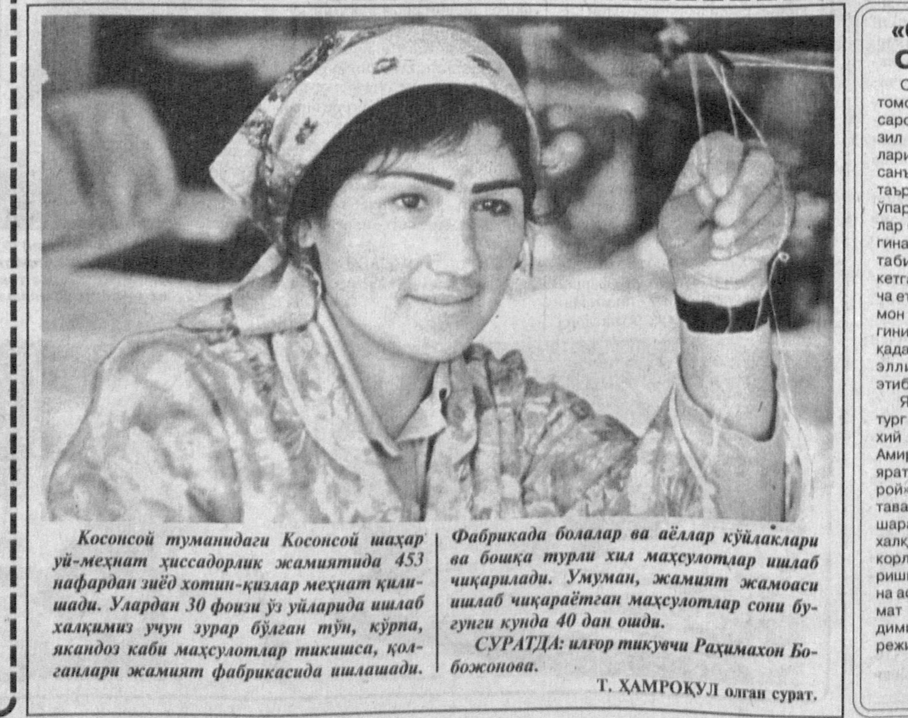
Косонсой туманидаги Косонсой шаҳар ўш-меҳнат хиссадорлик жамиятида 453 нафардан зиёд хотин-қизлар меҳнат қилишди. Улардан 30 фоизи ўш уйларида ишлаб халқимиз учун зувар бўлган тўри, қўрпа, якандоз каби махсулотлар тақваси, қолганлари жамият фабрикасида ишлайди.

Саҳибқирон Амир Темур томонидан бунёд этилган Оқсарой қасри ўш даврининг фозил қишлари, жаҳон сайёҳлари томонидан меъморийлик санъати мўъжизаси сифатида таърифланган. Ушбу осмон-упар бини шунинг қасидада битилган. Қасрнинг анчагина қисми дарв фўнорлари, табиат таъсирида бузилиб кетган бўлса-да, унинг бизга етиб қолган қолдиқлари ҳамон хусн-тароватда танҳоликнинг намойиш қилиб, бу ерга қадим ранжиди қилаётган чет эллик сайёҳларни мафтўн этиб турибди.