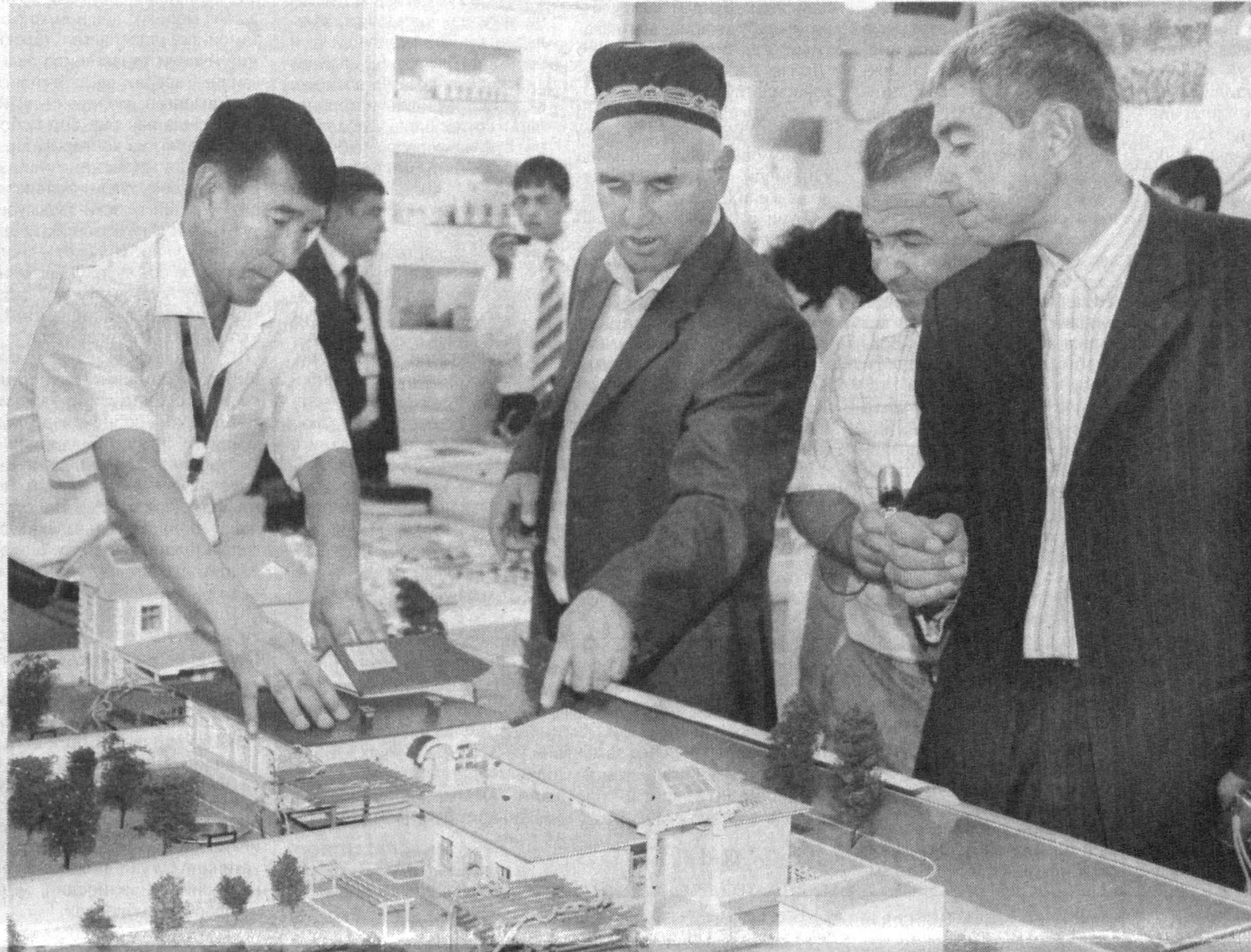
СУРАТДА: қўرғазма иштирокчилари замонавий уй-жойлар лойиҳалари билан танишмоқдалар.