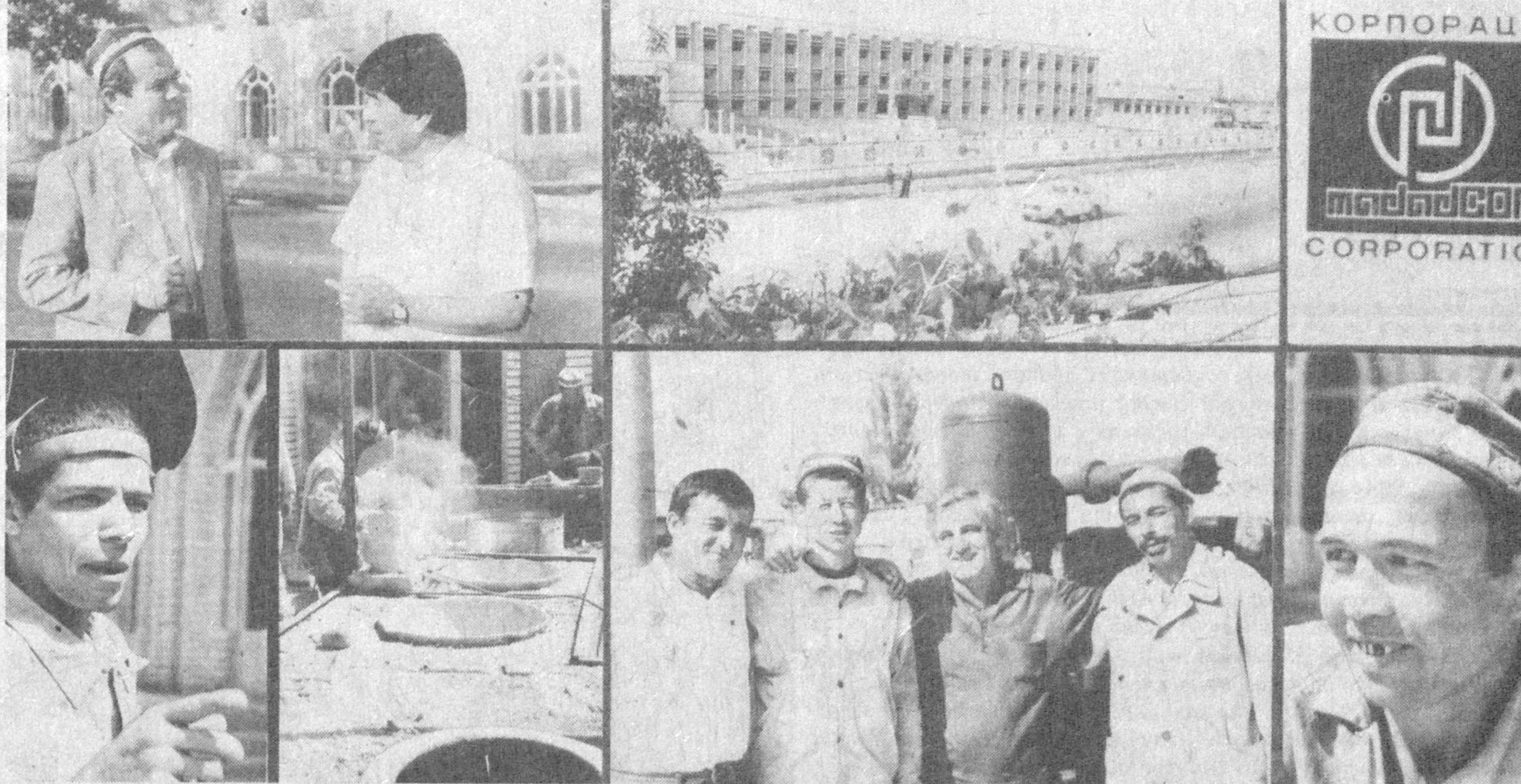
1988 йили Наманган шаҳрида «Мадак-кор» хусусий корпорацияси ташкил этилганда унинг бор-йўғи 15 нафар аъзоси бор эди. Бугунги кунда ушбу жамоада 380 дан зиёд ишчи-хизматчи меҳнат қилмоқда. Утган муддат мобайнида улар бир қанча савдо дўконлари, дорихоналар, ишлаб-чиқариш цехларининг биноларини тиклаб беришди. Айни чоғда бунёдкорларнинг саяё-харакати билан шаҳарнинг «Уйчи» даҳасида...