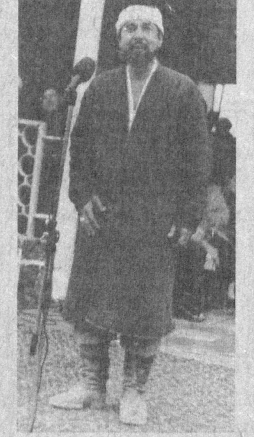
Ча халқнинг кўнғилини овлашга, бир оз бўлса-да қудирлишга ҳаракат қилиб келишман. — Ҳўл-қизлар қанча?