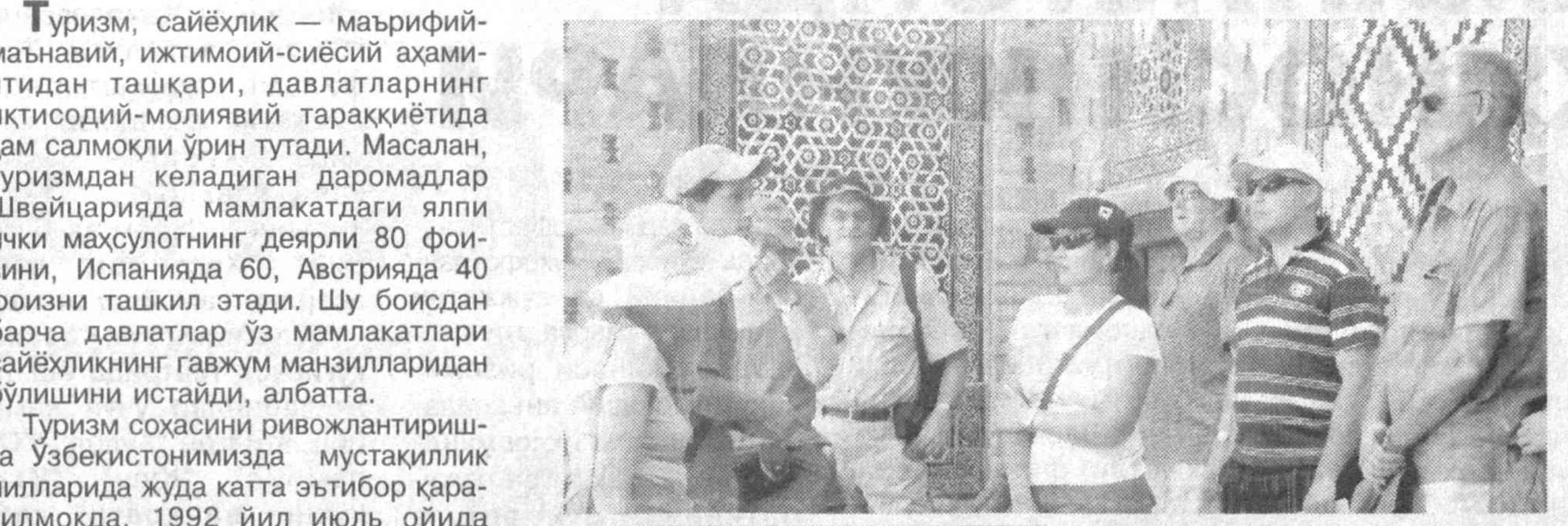
27 сентябрь — Жаҳон сайёҳлик куни

Туризм, сайёҳлик — маърифий-маънавий, ижтимоий-сиёсий аҳамиятидан ташқари, давлатларнинг иқтисодий-молиявий тараққиётида ҳам салмоқли ўрин тутadi. Масалан, туризмдан келадиган даромадлар Швейцарияда мамлакатдаги ялпи ички маҳсулотнинг деярли 80 фоизини, Испанияда 60, Австрияда 40 фоизни ташкил этади.