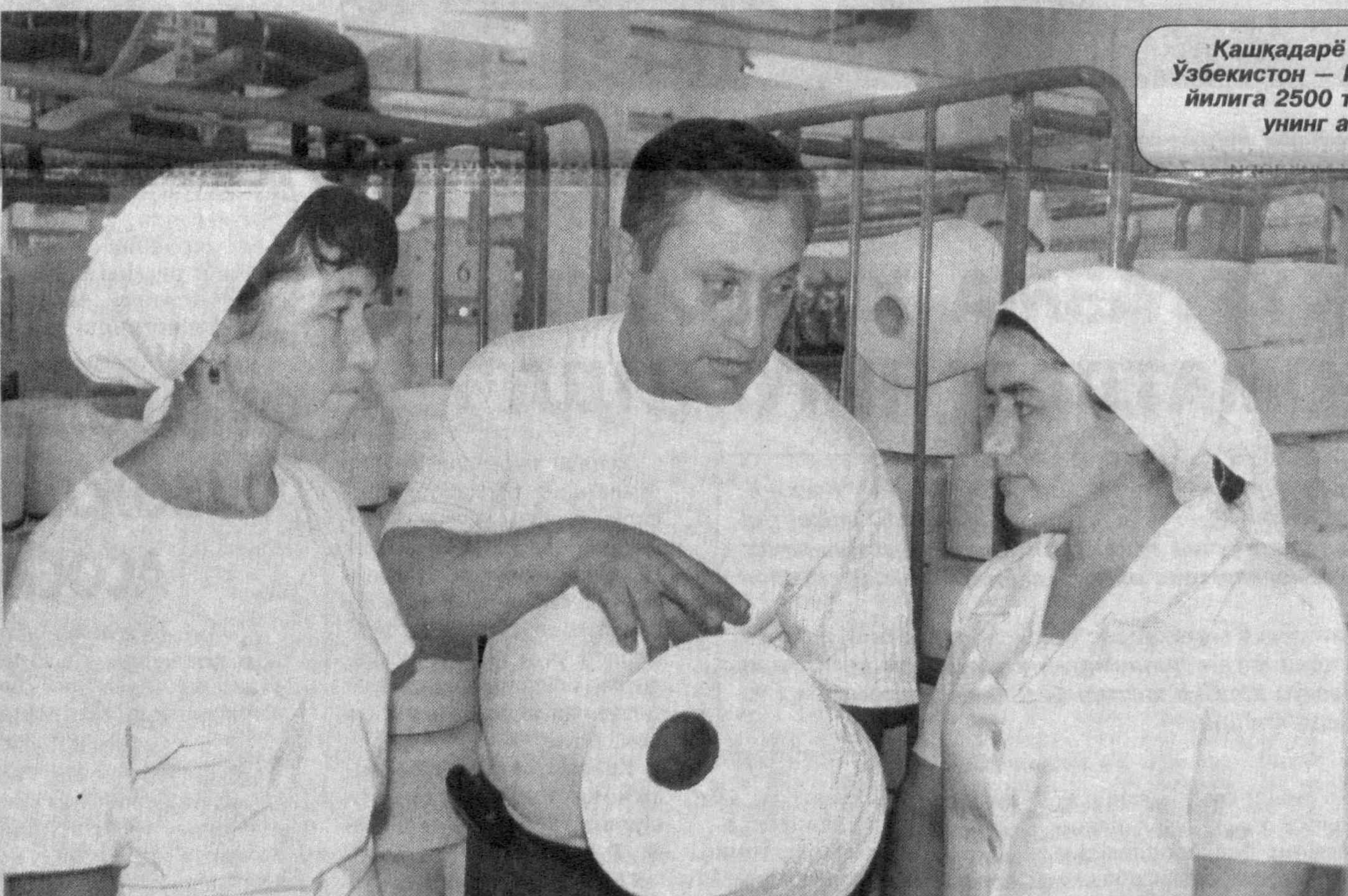
Қашқадарё вилоятидаги "Яккабоғ текс" Ўзбекистон — Германия кўшма корхонасида йилга 2500 тонна қалава ип тайёрланиб, унинг асосий қисми экспорт қилинмоқда.