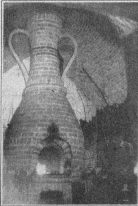
БОБОЛАР МЕРОСИ — МУКАДДАС