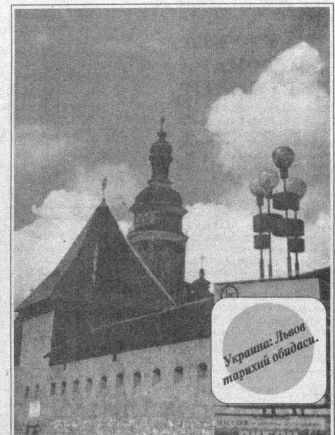
Украина: Львов партияси оидаси.

бўлди. Канал решининг нураб тушиши бошқа пайтларда ҳам такрорланиб турипти. Бу, табиийки, экинни вақтида сугоришға тўғаноқ бўлмоқда. Масалан, 28 июль куни ҳам қирғоқнинг силжитиш 70 куб сувнинг йўлини тўсиб қўйди. Гоҳида ўша каналға сувини чиқариб берадиган насос бузилди. Гоҳида ўша насосни ишлатиш десалар, энергияни эжақиб мақсадда электр турбина куриб қўйилди, булди. Гоҳида бўлса каналнинг сув манбаи «Жанубий Сурхон сув омбори» таъминлаш қолди. Хулласи калом, уч-тўрт йилдан буён галлаға пахта етиштириш шартнома режаларини (Шеробол йилиға 51 минг тонна пахта ва 50 минг тонна галла ишлаб чиқариш юқини зиммасига олган туман) бажара оймай ер чизиб қолаётган одамлардан қолоққининг сабабини сўраб қолсангиз, экинмизиз суваб куриб кетаяпти деган жавобни эшитасиз. Асосий иши қалдр-