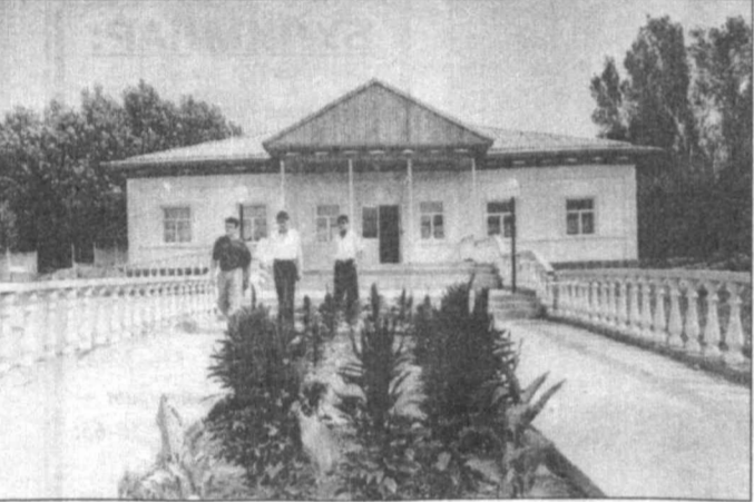
Галлаорол туманидаги Соврак қишлоқлари аҳолиси Муллабулоқ, Шерқонли ва тиббий ёрдам олиш учун

Марказга қатнаш ташвишидан халос бўлдилар. Чунки, бу ерда янги врачлик пунктлари фаолият кўрсата бошладилар.