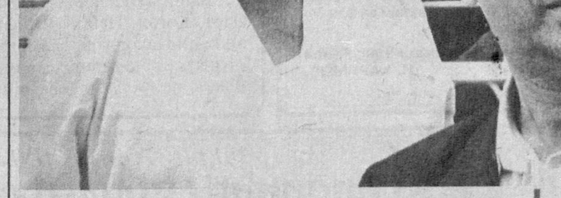
Шахрихонда давлат тасаруфидоги мулкларни хусусийлаштиришга қатна эштибор берилган.

1942—45 йиллар урушида иштирок этиб, ғалабадан сўнг 1946—1957 йилларда Наманган вилоятининг Мингбулоқ (собиқ Задар) туманидаги Қайрағочовул қишлоғида ўқитувчилик қилдилар.