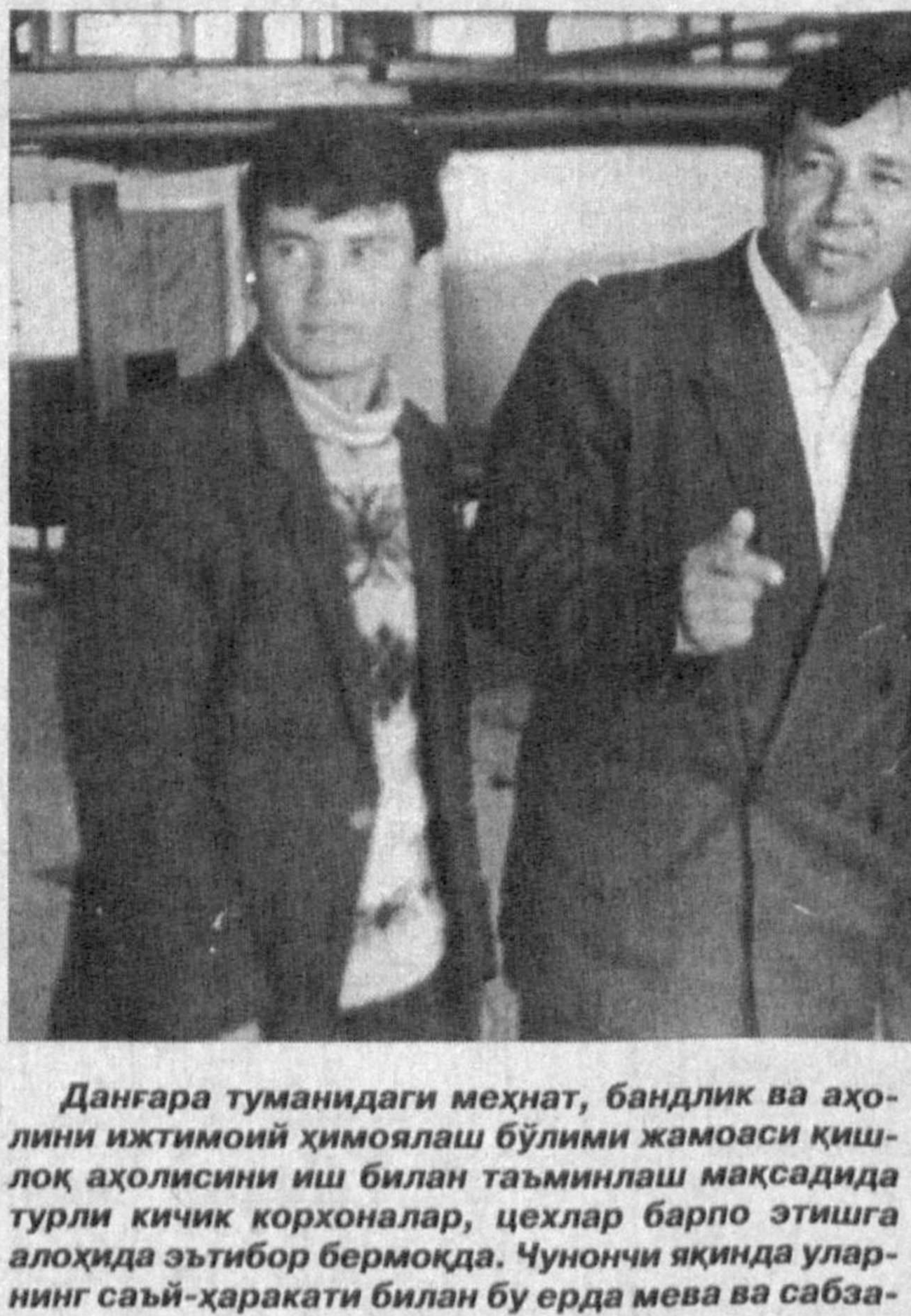
Дангара туманидаги меҳнат, бандлик ва аҳоли ижтимоий ҳимоялаш бўлими жамоаси қишлоқ аҳолисини иш билан таъминлаш мақсадида турли кичик корхоналар, цехлар барпо этишга алоҳида эътибор бермоқда. Чунки яқинда уларнинг сая-ҳаракати билан бу ерда мева ва сабзавотларни қайта ишлайдиган кичик завод куриб битказилди.