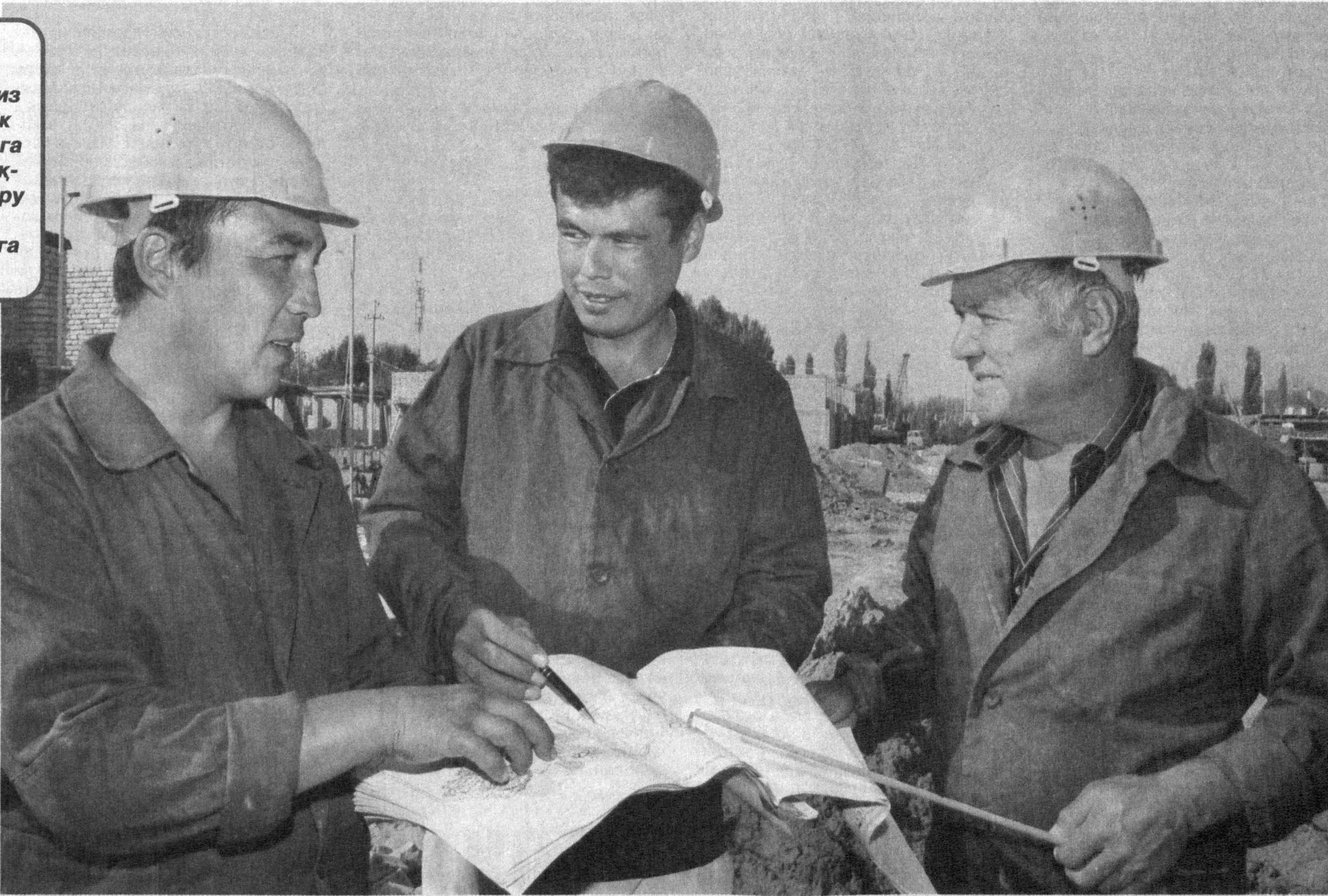
Энг муҳими, унинг ҳудудлар иқлим шароити ва удуларимиздан келиб чиққан ҳолда қурилаётгани айни мудида бўлаётир. Андижон туманидаги Оқёр қиш- логида шундай қўлайликларга эга 57 та уй-жой қад ростламоқда. Мазкур биноларнинг барчаси икки қаватли бўлиб, 6 хонадан иборат. Қурилиш жараёнида эса Улуғнор туманидаги "Ҳамро ҳамжихат келажак" фирмаси жамоаси фаол иштирок этмоқда. Ушбу фирманинг 80 нафар қурувчиси шу кунларда 8 та уй-жойни ўз эгаларига топириш ниятида қизгин меҳнат қилмоқдалар. СУРАТДА: қурилиш жараёнидан лавҳа.

Мамлакатимизда Истиклолнинг дастлабки йиллариданоқ Президентимиз раҳнамолигида бунёдкорлик ва ободонлаштириш ишларига алоҳида эътибор қаратилмоқда. Бунинг натижасида шаҳару қишлоқларимиз қиёфаси тубдан ўзгариб, йилдан-йилга гўзаллашиб бораётир.