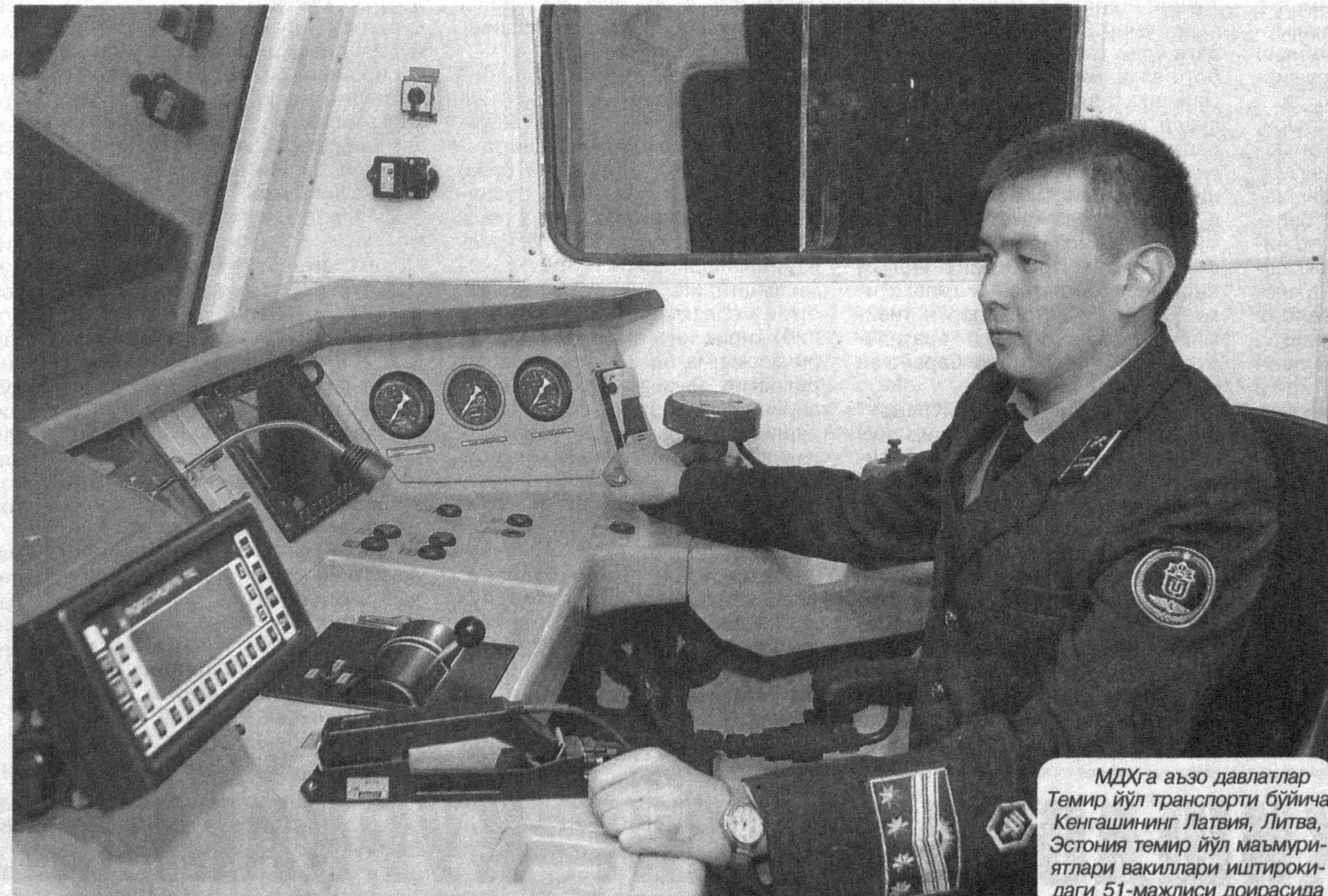
МДХга аъзо давлатлар Темир йўл транспорти бўйича Кенгашининг Латвия, Литва, Эстония темир йўл маъмуриятлари вакиллари иштирокидаги 51-мажлиси доирасида «Тошкент йўловчи вагонлари» ни қуриш ва таъмирлаш заводи» очик акциядорлик жамиятида «Ўзбекистон темир йўллари» давлат акциядорлик компанияси тизимида кирувчи турта йирик ишлаб чиқариш корхонасида ишлаб чиқарилган транспорт воситаларининг тақдирот маросими бўлиб ўтди.