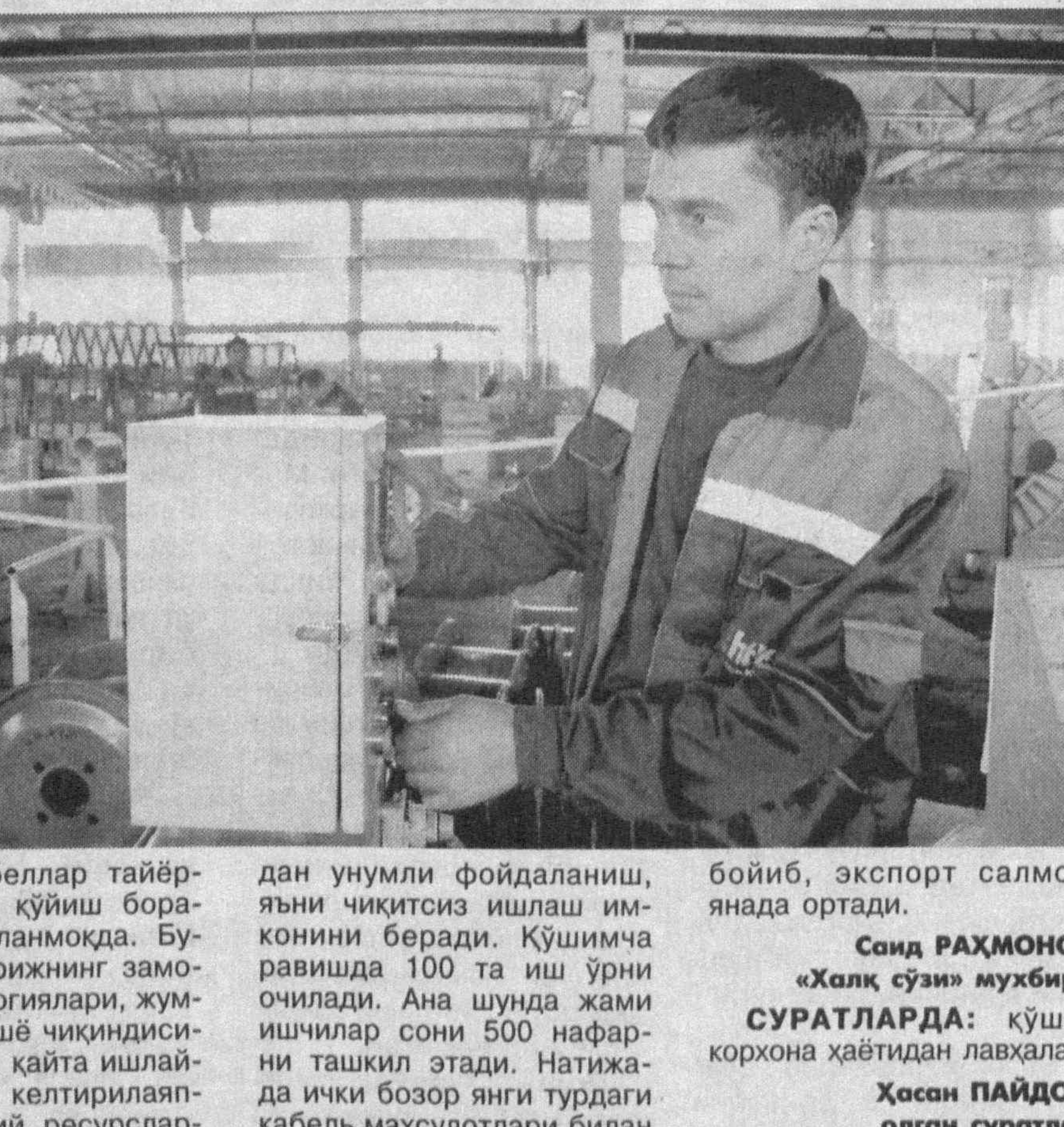
дан унумли фойдаланиш, яъни чиқитиш ишлаш имконини беради.

лиард сўмлик маҳсулот тайёрлаб, ўтган йилнинг шу давридагига нисбатан кескин ўсишга эришилгани бунинг исботидир.