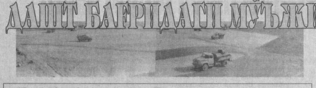
Шу кунларда жадал давом этаётган Шўртангаз-кимё мажмуи қурилишини чинакам маънода мўъжизага қиёслаш мумкин. Умумий қиймати 1 миллиард 200 миллион АҚШ долларига тенг бўлган ушбу йирик саноат мажмуи фойдаланишга тояширигач, мамлакатимиз саноатининг гултожларидан бири бўлиши, шубҳасиз. Чунки келажакда бу ерда пластмасса, полиэтилен сингари қимматбаҳо хомашёлар кўпайиб миқдорда ишлаб чиқарила бошланади.

«Ўзсуқурилиш» ташкилотларининг техникалари билан бир қаторда «Ўзавтотранс» Давлат акционерлик корпорациясининг қарийб барча вилоятлардаги бирлашмаларидан келган жами 600 та турли руюмдаги юк машиналари ҳам иштирок этапти, — дейди «Қаршиқурилиш» трестига қарашли 13-механизациялашган ишлар бошқармаси бошлиғи Парда Узоқов. — Иш икки сменала ташкил этилган. Ҳайдовчилар зиммаларидаги вазифаларни кўнгилдагидек адо этишапти. Айниқса, «Намангантранс», «Самарқандтранс», «Қашқадарётранс» ва «Тош-