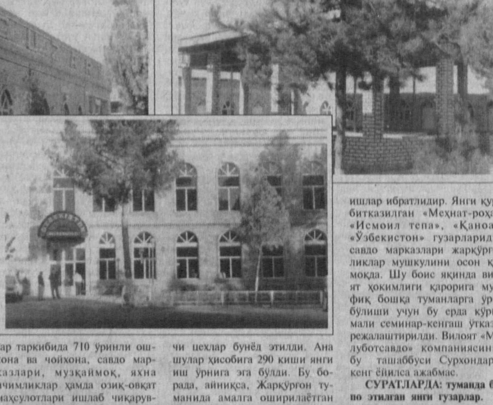
Кейинги пайтда Сурхондарёда янги гузарлар қуриш урғи айлиниб қолди, десак янгилимаймиз. Ҳозир вилоятда янги қурилган 17 та савдо гузарлари, 8 та савдо маркази ишлаб турибди. Вилоят «Матлуботсавдо» компанияси бу қуриш ишларига 1998 йилда 100 миллион сўмлик капитал маблағ сарфлади. Аҳамиятли томон шундаки, сарфланган маблағларнинг ҳаммаси шу тизимдаги корхоналар ҳамда ишловчиларга тегишлидир. Натияжада 2200 квадрат метрик гу-

зар таркибиди 710 ўришли ошхона ва чойхона, савдо марказлари, музқаймоқ, янги ичимликлар ҳамда озиқ-овқат махсусотлари ишлаб чиқарувчи цехлар бунёд этилди. Янги шулар ҳисобига 290 киши янги ўрнига эга бўлди. Бу боғида, айниқса, Жарқўрғон туманида амалга ошириладиган