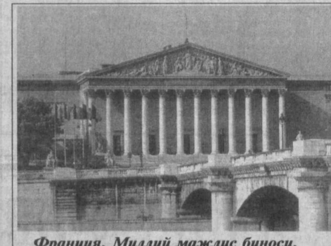
Франция. Миллий мажлис биноси.

1995 йилнинг октябр ойида мамлакатларимиз ўртасида дипломатик муносабатлар уриштирилди. Икки томонлама савдо-иқтисодий алоқалар ўзаро манфаатли равишда ривожлантиришга бўлган ҳар икки томоннинг иштирокида ўз ифодасини топган. Буғунги кунга келиб имоноланган унга яқин икки томонлама хўжатлар, жумладан дўстлик ва ҳамкорлик тўғрисида, инвестицион узаро рағбатлантириш ва химоя қилиш, икки томонлама солиқ солинишига йўл қўймаслик, ҳаво қатнови, илмий-техникавий ҳамкорлик, темир йўл, автомобиль транспорти ва транзит соҳаларида ҳамкорлик қилиш тўғрисидаги хўжатлар амалда. Ушбу шартномаларнинг ҳуқуқий пойдеворида Ўзбекистон Президентини Илоҳ Каримовнинг 1996 йил июнь ойида Руминияга қилган ташрифи чоғида асос солинган эди. Мазкур таш-