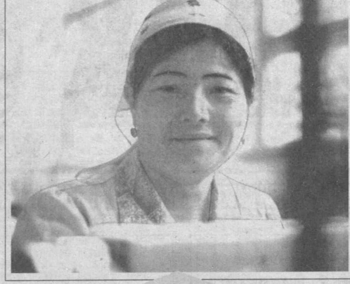
Норин туманидаги «Ҳаққулобод» тўқувчилик фабрикаси жамоаси истеъмолчилар талаб-истакларини ўрганган ҳолда маҳсулот ишлаб чиқаришмоқда. Шунинг учун бўлса керак, фабрика тўқувчилари томонидан сотувага чиқарилаётган кийим-кечақлар харидориг.

Шу ўринда маънастанинг яна бир томониға эътиборни қара-тайлик. Бунга Президентимиз-нинг бурча эзуу ниғтилар, ҳа-ққнинг турмуш тарзини яхши-