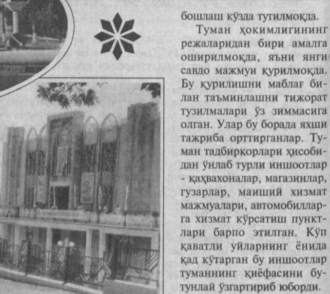
бошлаш кўзда тутилмоқда. Туман ҳокимлигининг режаларидан бири амалда оширилмоқда, яъни янги савдо мажмуи қурилмоқда. Бу қурилишни маблағ билан таъминлашни тижорат тузилмалари ўз зиммасига олган. Улар бу борада яхши тажриба орттирганлар. Туман тадбиркорлари ҳисобидан ўнлаб турли иншоотлар - қаҳвахоналар, магазинлар, гузарлар, маиший хизмат мажмуалари, автомобилларга хизмат кўрсатиш пунктлари барпо этилган. Кўп қаватли уйлarning ёнида қад кўтарган бу иншоотлар туманининг қиёфасини бутунлай ўзгартириб юборди.

Ҳолбуки, туман бюджетига тушумни айна шундай корхоналар таъминлайди, бюджет тушумларининг асосий қисмини кейинчалик ижтимоий соҳани ривожлантиришга, ободончилик ишларига сарфлаш мумкин бўлади. Бу ҳусулда туман ҳокимлигининг режалари жуда катта. Маҳаллий ҳокимият асосий кўчаларни қайта қуриб бўлгандан сўнг, уй-жой ҳаётларини янгилашни бошлаб юборишни мўъжалламоқда. Зарур жойларда эса болалар спорт майдончалари қурилишини