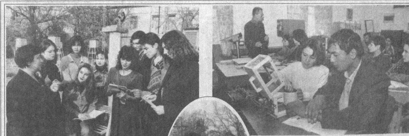
Жорий йилнинг декабрь ойида Тошкент Гидрометеорология Техникуми ташкил қилинганга 50 йил тўлди. У Марказий Осиёда ягона эканлиги билан ҳам аҳамиятлидир. Ўқув юрти, ўтган ярим аср мобайнида минглаб метеоролог, гидролог, агрометеоролог ва радиотехник-метеоролог сингари мутахассисларни етиштирди. Мазкур даргоҳни битириб чиққан мутахассислар айни пайтда жаҳоннинг йиғирмага яқин мамлакатларида фаолият кўрсатмоқдалар. Энг қувончлиси,

Фалокатлар бу билан ҳам туманади. Айниқса, шу «Зарафшон» жамоа ҳўжалигида. Навбаҳор тумани худудидан бошланган Шўрча, Оқсоқолота сойлари бир неча марта то-