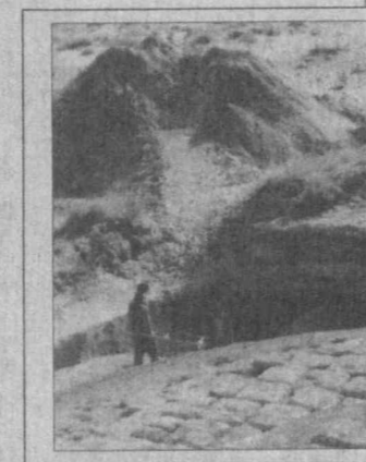
Ҳозирдан баралла айтиш мумкинки, биз эрамиздан аввалги IV асрга оид ҳаётнинг ички қатламларига кирдик, ундан ҳам қадимроқ даврларга оид маданият ҳаётининг талқини қилиш, тарихнинг азал саҳифаларини ўрганиш имконияти бу ерда мавжуд...