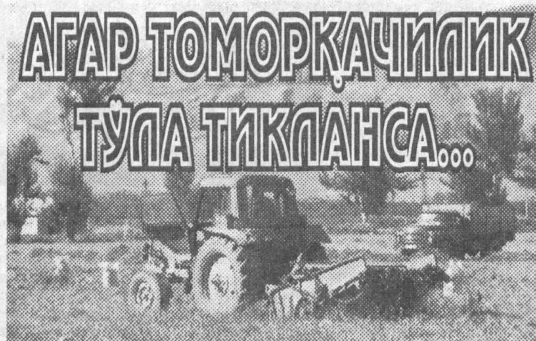
АГАР ТОМОРҚАЧИЛИК ТўПА ТИҚЛАНСА...

равар кам. Жамоа хўжаликларидан сабзавот ҳосилдорлиги республика бўйича 100—110 центнер, Хоразмда 150, Фарғона vodiysи вилоятларида 160—200 центнер бўлса, тажрибали деҳқонлар шунча ҳосилни 10 сотих томорқадан ҳеч қийналмай оли-