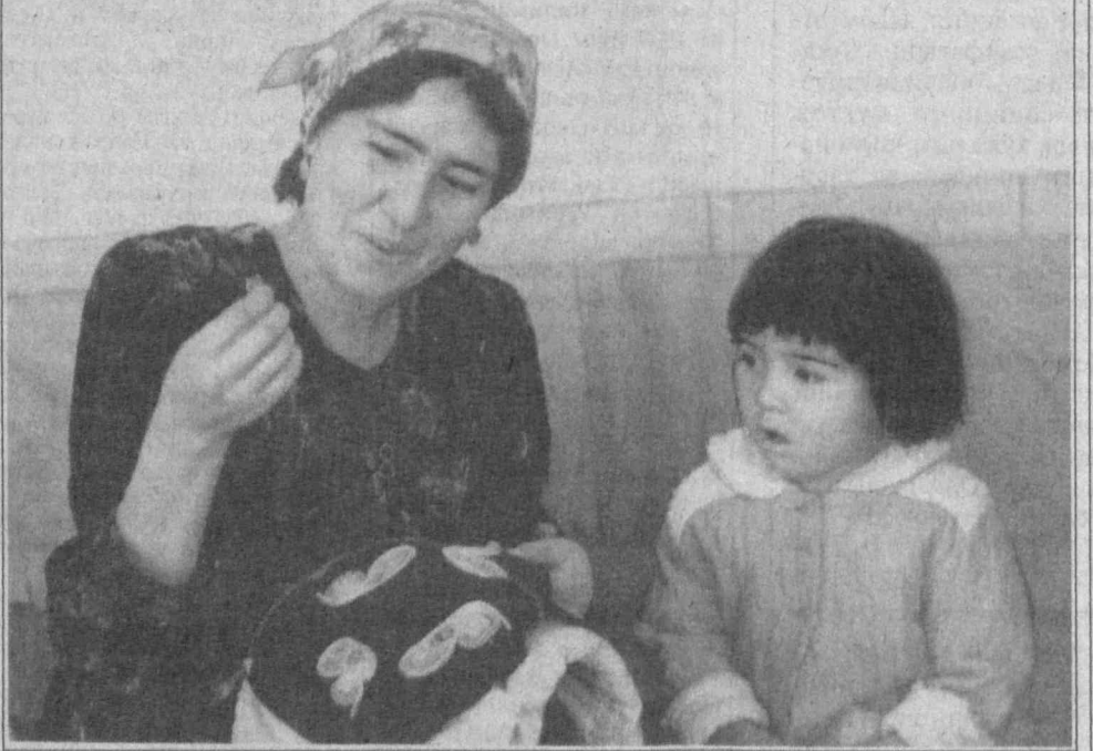
Устоз ва шогирд