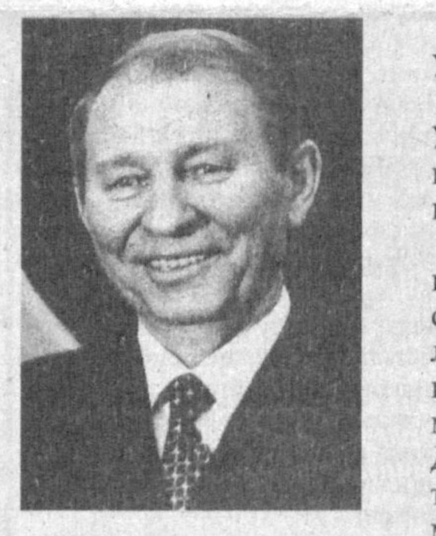
бюросида бош конструкторнинг биринчи ўринбосари. 1986—1992 йилларда — «Жанубий машинасозлик заводи» (Днепропетровск шаҳри) ракета-созлик концернининг бош директори.

1938 йил 9 августда Чернигов вилоятининг Чайкино қишлоғида туғилган. 1960 йилда — Днепропетровск Давлат университетини тугатган. Техника фанлари номзоди илмий даражасига эга. 1960—1975 йилларда — «Южное» (Днепропетровск шаҳри) конструкторлик бюросида муҳандис, катта муҳандис, етакчи конструктор, бош конструктор ёрдамчиси, Бойқўнғирда (Қозғистон) техник раҳбар. 1975—1982 йилларда — «Южное» конструкторлик бюросида партия ташкилотчи котиби. 1982—1986 йилларда — «Южное» конструкторлик