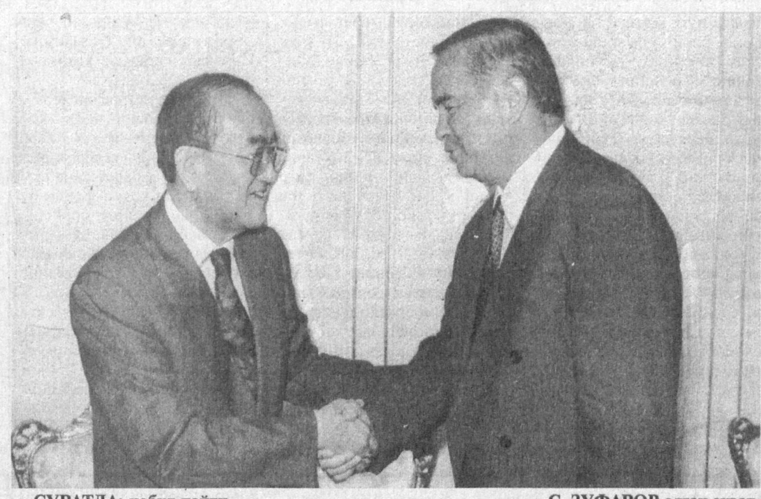
СУРАТДА: қабул пайти.

16 июнь кuni Ўзбекистон Республикаси Президенти Ислом Каримов Жаҳон соғлиқни сақлаш ташкилати бош директори Хироши Накажими қабул қилди. Мамлакатимиз раҳбари меҳмонга Ўзбекистонда амалга оширилаётган ижтимоий-иқтисодий ислохотлар жараёни, соғлиқни сақлаш ва экология муаммоларини бартараф этиш соҳасида амалга оширилаётган ишлар ҳақида сўзлаб берди. Бу борада халқаро ташкилотлар, жумладан, Жаҳон соғлиқни сақлаш ташкилати билан ҳамкорлик қилишга алоҳида эътибор берилаётганини таъкидлади. Хироши Накажима ўзи раҳбарлик қилаётган халқаро ташкилот Ўзбекистон билан ҳамкорликни янада кенгайтиришга тайёр эканлигини айтиб, бу борада амалга оширилажак ишлар яхши натижалар беради, дея умид билдирди. Сўхбат чоғида ижтимоий-иқтисодий тараққиёт, Орол