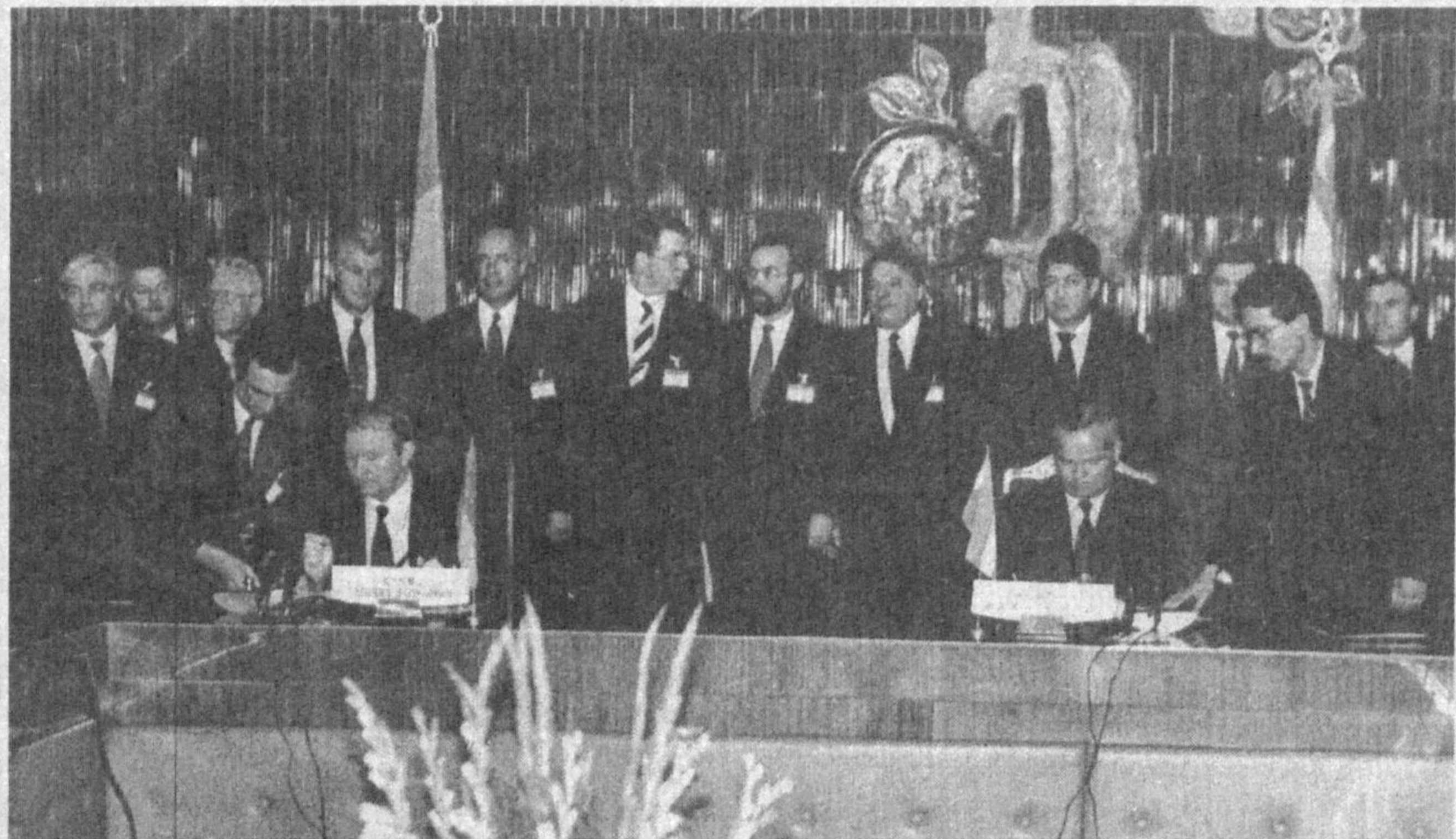
СУРАТЛАРДА: ҳужжатларни имзолаш маросими ва Тошкент аэропортида кузатиш маросими.

Украина Президенти Леонид Кучма мамлакатимизга ташрифнинг иккинчи кунини Украин маданияти маркази фаоллари билан учрашиш учун Ўзбекистон байналмилал маданий марказига келди. Бу ерда олий даражали меҳмонга мамлакатимизда истиқомат қилаётган украин миллиятига мансуб фуқароларнинг «Баткишина» маданий маркази раиси Станислав Мансуров-Кавригенко ҳамда марказнинг бир гуруҳ фаоллари пешвоз чиқди.