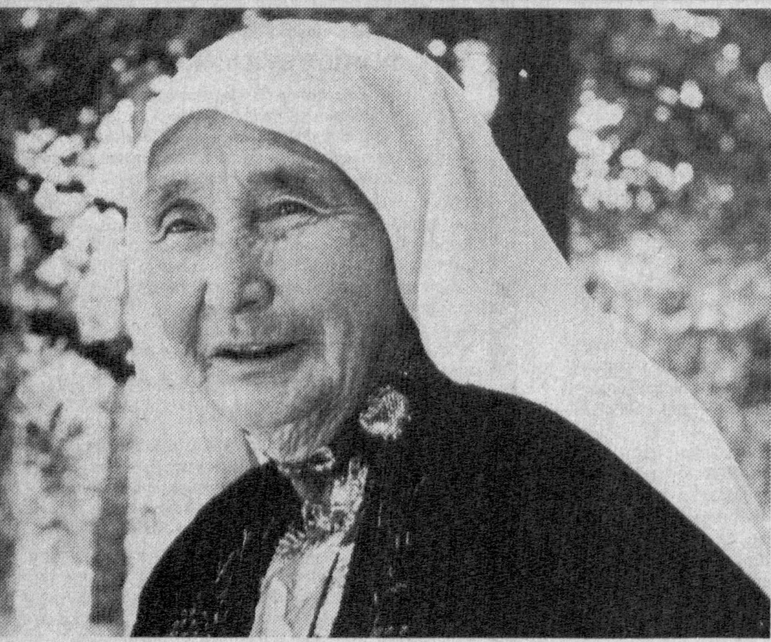
Сарбар ая Мадрахимовани Янгикўрғон туманида танимайдисанлар кам бўлса керак. Чунки аянчи пиллачилликдаги тажрибаси тумандагина эмас, вилоятда ҳам кенг қўлланилмоқда. Айни кунда Сарбар ая 80 ёшда. Шунга қарамай, сувоқли иши — пиллакорликни тарк этгани йўқ. Чунончи, бу йил шогирди Улуғжон Исмаилова билан биргаликда 75 кўни уруғчи инкубаторда жонланттириб, пиллакорларга тарқатди.

Муҳамел АСИМОВ, Тожикистон Фанлар академияси академиги, Россия Фанлар академияси мухбир аъзоси, Марказий Осиё Фанлар академияси академиги, ЮНЕСКО қошдаги Марказий Осиё маданиятини ўрганиш бўйича Халқаро ассоциация Президентини, Жаҳоҳарлаъ Неру номидаги халқаро муқофот совридорини.