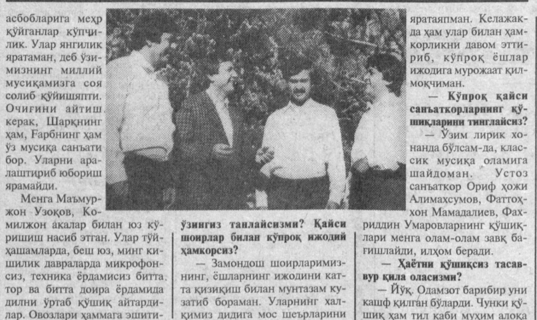
Олимжон Орифжонов ҳақида мақола