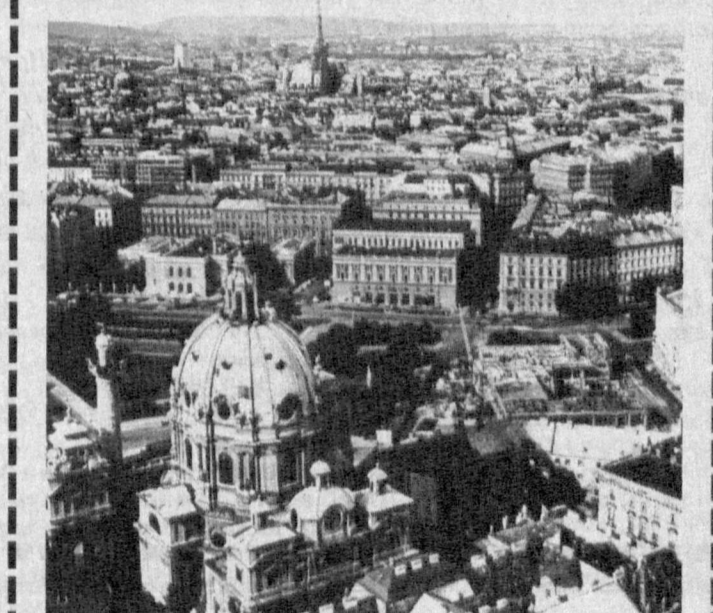
Вена — Европадаги энг гўзал шаҳарлардан бири.

Бироқ, хавфсизлик кенашини Босния сербларидан ушбу автомашиналарнинг ўтишига ҳалақит бермасликни талаб қилган. БМТ Бош котибининг расмий вакили Фред Экхарднинг айтишича, «Қўрол-яроғ солинган иккита ўқур юк машиналардан бирининг ўтиригичи тагидан топилиган».