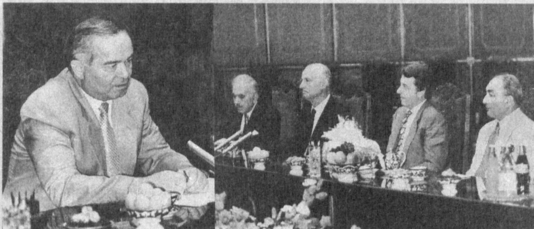
СУРАТДА: қабул пайти.

11 июль кuni Ўзбекистон Республикаси Президенти Ислам Каримов Туркиянинг «Коч холдинг А.Ш.» компаниялари гуруҳи президенти ва ижрочи директори Инан Кирач бошчилигидаги делегация аъзоларини қабул қилди.