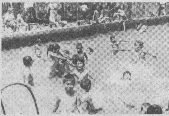
шароитда қиммат эмас.

— Йўқ, транспорт хизмати ҳисобга олинганда, у ҳар бир болага 80-120 сўмдан тўри келаяпти. Менинча бу ҳозирги