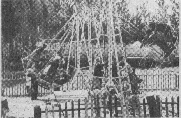
Уша оромгоҳларни оталиққа олган ёки бевосита, бунёд қилган ташкилот, муассаса, корхоналарнинг саноат-қаракатида боллиқ, Лексин шундай болалар оромгоҳлари ҳам борки, рости, ҳамнинг ҳаваси келмай ило-

Маълумки, болаларнинг ёзи тавлини сентябрь ойига қадар давом этади. Мен фурсатдан фойдаланиб, мамлакатимиздаги барча ота-оналарга сеvimли ва ёқимтой болажонларини оромгоҳларимизда дам олишга, ёзи тавлини маълумли ҳамда кўнгалдагидек ўтказишлари имконият яратиб беришларини истар дегим. Чунки, болалар келажатимиз, мустакил Ўзбекистоннинг ворисларидир.