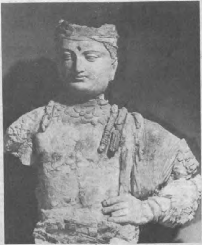
Эрамининг II—III асрида ясалган ҳайкал.

— Бундай катта ҳазина топган киши сифатида сизни мукофотлашган бўлса керак? — Албатта. Менга икки ойлик миқдорда мукофот пули беришди. Бундан ташқари мен уша пайтда уч қонали уй олишим керак эди. Мукофот тарихисидда беш қонали уй беришди. Энг муҳими, экспедициямизга катта