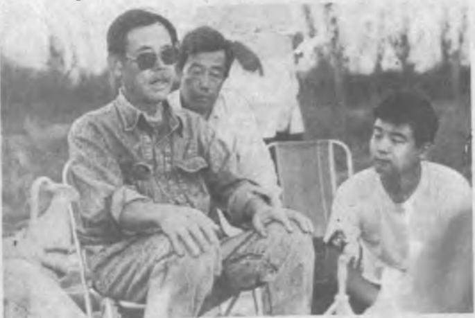
Като Кюзо Далварзиптепада

бу тулган сув тулдирилган ханда билан уралган. Бу — мухофазанинг бир усули. Маълумотларга қараганда, шаҳарнинг битта дарвозаси бўлган. Бу ҳам қадимги шаҳарларга хос белги. Урта асрларга келиб, шаҳар дарвозалари қулайган. Буни Тошкент, Самарқанд мисолларида кўриш мумкин.