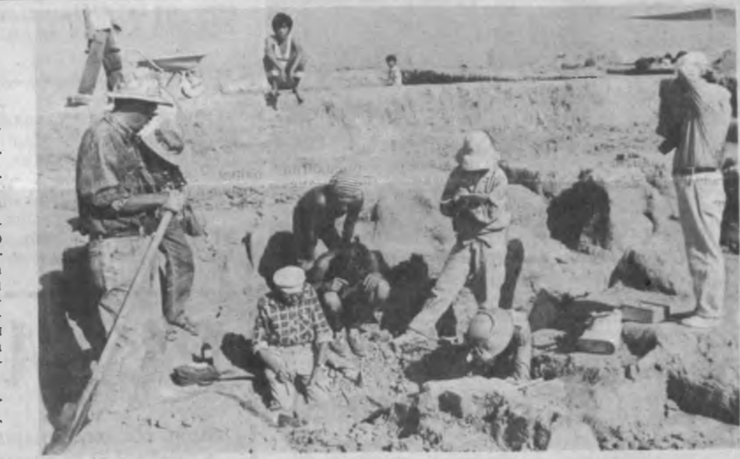
Тупроқ остидаги Будда ибодатхонасини «кашф этиш».

Шаҳар 36 гектар майдонни ишғол қилади. Шунинг икки гектари подшо қароргоҳи. Қароргоҳ шаҳардан баландда жойлашган. Уша давр таомилга мувофиқ