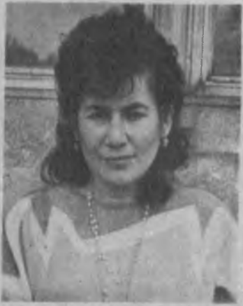
Кўнгил кушлари (Туркумдан)

Ногоҳ туман тугди ҳавони, Ногоҳ дилни кезар дарабдор. Мен ўзини қайта қўярдим, Булмасангиз ёнида агар.