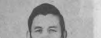
Тошкент шаҳри айна пайтда маҳаллалар иши бўйича илғий-амалий, услубий марказга айланган.

Тошкент шаҳри айна пайтда маҳаллалар иши бўйича илғий-амалий, услубий марказга айланган. Бу ерда ўтган давр мобайнида 150 га яқин янги маҳалла тузилди.