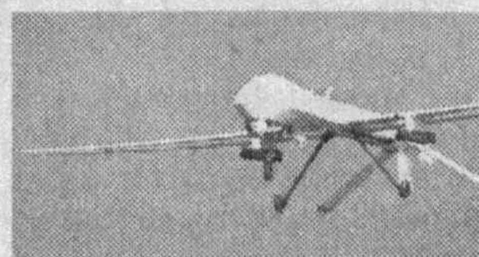
манбаларда тасдиқлангани йўқ.

Ҳарбий амалиёт чоғида тўданинг тўрт нафар аъзоси йўқ қилинган. Ҳалок бўлганлар орасида ташкилот раҳбари Усама бин Ладиннинг гўштакиси Ойман ал-Заваҳрининг ҳам борлиги айтилмоқда.