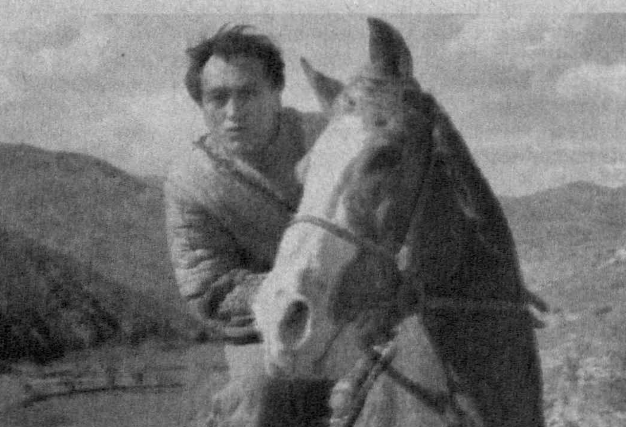
Халқимизда азал-азалдан турли тўй-тантаналар, умумхалқ байрамларида миллий спорт уйини — кўпқари-улоқ мусобақаси ташкил этиб келинган. Ушбу тадбир йигитларни руҳан ва жисмонан чиниктириш, уларда ҳалоллик, орият ва гурур сингари фазилатларни шакллантиришга хизмат қилган, албатта.

маълумотлар, нақшбандия тари-қати тарихи ва моҳияти ҳақида баҳс юритувчи тадқиқотлар, шу-нингдек, "Нақшбандия" журнали-да чоп этилаётган эътиборга мо-лик мақолалар Интернетда очил-ган сайтимизга жойлаштириляпти. Марказимиз биносидан хатто-лик кўргазмаси ташкил этилиб, унда ноб хат намуналари жам-ланган. Шарқшунос ва манбашу-нос олимлар ҳамда марказ илмий жамоатчилиги ҳамкорлигида иор-данялик тарихчи Эҳсон Зунун Абдуллатиф ас-Сомирий қалами-га мансуб "Бухоро шахрининг ма-даный тарихи. 712-999 йиллар во-қеалари" китоби арабчадан ўзбек тилига таржима қилиниб, нашра-га тайёрланди. Шунингдек, Баҳоуд-дин Нақшбанд ҳазратларининг "Аврод" асарларига шарҳ битган Али ибн Аҳмад-ал-Ғурийнинг "Шарҳи аврод", Абдулқарим ас-