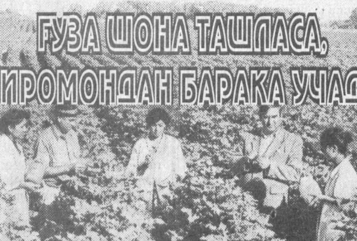
Буни унутган пахтакор кузда ер қизиб қолиши ҳеч гап эмас

Ҳозирги пайтда гўза авжи ўсиш палласида бўлиб, кўп сув истеъмол қилади. Шунинг учун тупроқнинг намлик даражаси пасайишига асло йўл қўйиш мумкин эмас. Июль, август ойлари давомида гўза пайкалидаги тупроқнинг нами атроф муҳит ҳусеиятиридан қатий назар, 70-75 фоиздан кам бўлмаслиги зарур. Намнинг аҳадияти шундаки, сув биринчидан, ўсимлик тўқималарининг хароратини изга солиб туради, иккинчидан, гўза танаси билан пайкалдаги ҳаво харорати бир маромда бўлишини таъминлайди. Шундай экан харорат 40 даража атрофида бўлган ҳозирги даврда иккиланмай, тунги сугоришни тўғри йўлга қўйиш лозим. Чунки, тунги сугориш ўсимлик ривожига кўмаклашадиган, гўза тупроқдан қабул қилиб оладиган озиқ моддаларни ва сувни қабул қилади, тана бўйлаб