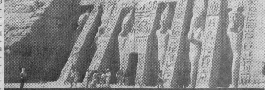
23 июль — Миср Араб Республикасининг миллий байрами