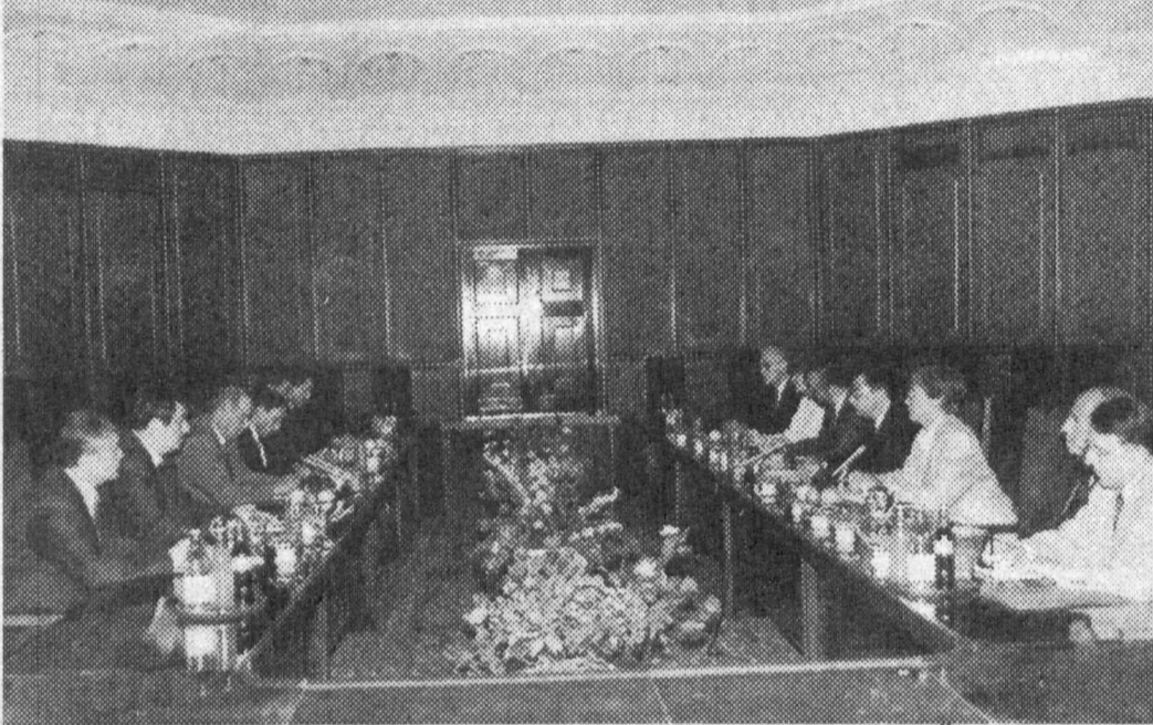
СУРАТДА: қабул пайти.