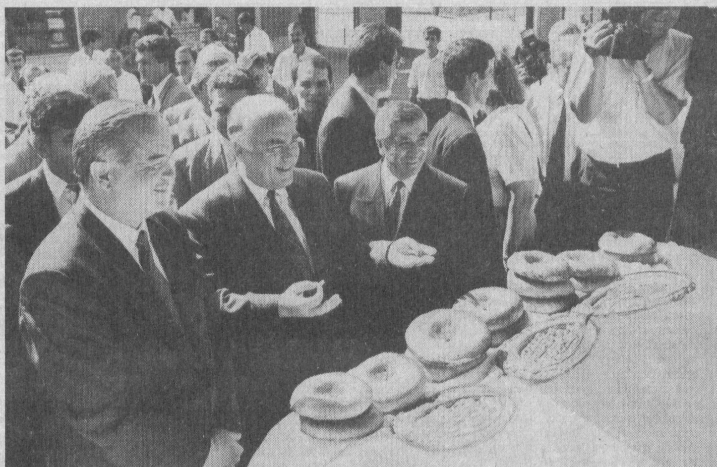
СУРАТДА: меҳмонлар Самарқандда.

Россия ҳукумат раҳбари шаҳардаги Сиёб бозоридан