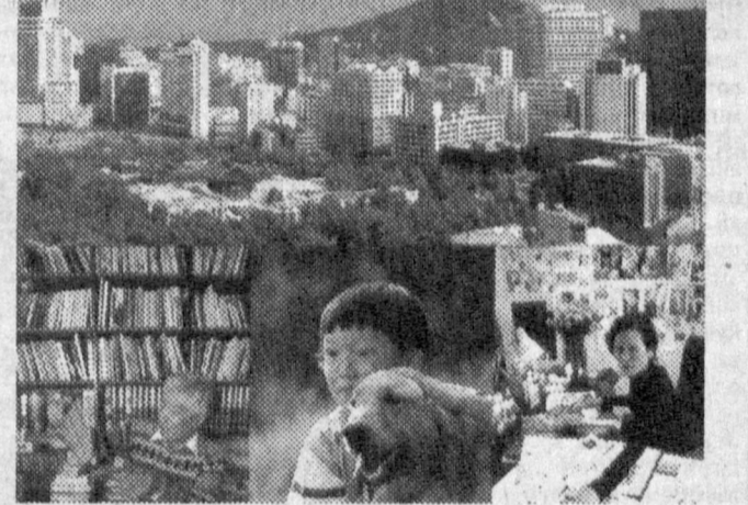
СУРАТДА: Корея Республикаси манзаралари

Тожикистон муҳолифати рақабияти яқин орада Россия ҳукумати Раиси Виктор Черномырдин билан учрашиш ниятида. Тожикистон демократик кучларини мувофиқлаштириш маркази бошқаруви раиси Отахон Латифий Россия ҳукумати Раисига шу мазмундаги мактуб етказилганлигини айтди. Россиянинг турли маҳкамаларидан минтақада кечаётган воқеаларга турфа фикр билдирилаётгани ана шундай учрашувни тақозо этмоқда. О. Латифий Тожикистон рақабияти билан муҳолифат ўртасидаги музокораларнинг 5 босқичи Алматида ёки Тихронда ўтказилиши мумкинлигини таъкидлади. Бу учрашувда ўт очишни тўхтатиш, мамлакат институциявий тузуми билан боғлиқ муҳим масалаларни муҳокама қилиш режалаштирилмоқда.