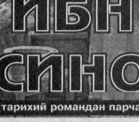
ИБН СИНО (тарихий романдан парча)

Лекин қизнинг гурури буюк, ҳатто ҳақимникидан ҳам. Юрагиди дардини ҳеч қачон, ҳеч кимга ўлса ҳам айтмайди. Бунақадим. Балки шундайдир, тақсир. — Раҳмат, минг раҳмат сизга. Майли, уч дирҳам сизга бўлсин. Аёлни мен ўзим рози қилурмен... — Йўқ, тақсир, бу мусулмонликка тўғри келмас, менинг ҳақимда ёмон фикрда бўлмағайсиз, ул аёл ҳам. Мана, тангани эҳтиётлаб қўйибурмен, буни ҳам беринг, уёғи ўзингизнинг ҳақматингиз, — деди-ю, чарм ҳамёндан тангаларни олиб, кўйра-қўймай ҳақимга қайтарди.