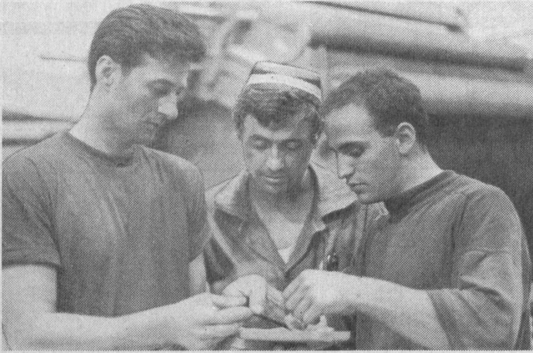
Сўнги пайтларда республикаимизда қўшма қорхоналар сон кўпайиб бормоқда. Ана шундай қорхоналардан бири яқинда Марғилонда «Ипакчилик» ҳиссадорлик жамияти ва Италиянинг «Гарден» фирмаси билан ҳамкорликда ташкил этилди. «Спиннинг — Силк» деб ном оingan ушбу ўзбекистон—Италия қўшма қорхонаси ҳиссадорлик жамияти раҳбаридан чиққан ипакчиликчилар ҳисобига ишлайди.

Ҳисоб-китоблар товуддан қурқа боқини фойдаланган эканини кўрсатди: бройлер етилганидан даврда қурқа семирди, вази 16 килограммдан 20 килограммга чад етар, бунинг учун товудқа нисбатан қармоқ озуқа кетар экан. Хонободлик ишбилармонлар Фарғона вилоятидаги «Чимён» агрофирмасида Исроилдан олиб келинган қурқа тухумларини сотиб олиб, Уларнинг инкубаторларида жўжа очирди.