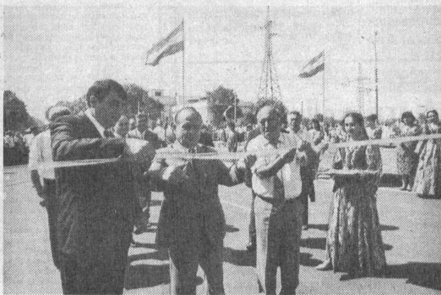
СУРАТЛАРДА: кўприкни очиш маросимидан лавҳалар.

Мустақилликнинг тўрт йиллигини нишонлашга тайёргарлик кўраётган республика пойтахти ҳаётида унутилмас воқеа юз берди: буюклар байрамига ҳақ қўриб битказиш мажбуриятини олган ишоотлардан бири — Беш-Ғочдаги Ёрғажар канал кўприги фойдаланишга топширилди. Шу муносабат билан 11 август куні тантанали митинг бўлди. Унда қурувчилар, лойиҳачилар, жамоатчилик вакиллари иштирок эттиди.