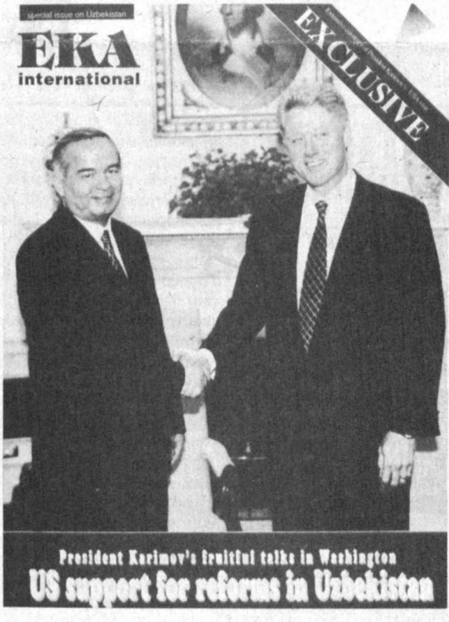
President Karimov's fruitful talks in Washington US support for reforms in Uzbekistan