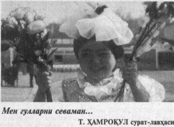
Мен гулларни севаман...

— Тўғри ва йўғон ичак касалликларини даволаш тиббий тилда проктология деб юритилади. Бунга баовил, ўткир ва сурункали мақсад оқмаси, мақсад