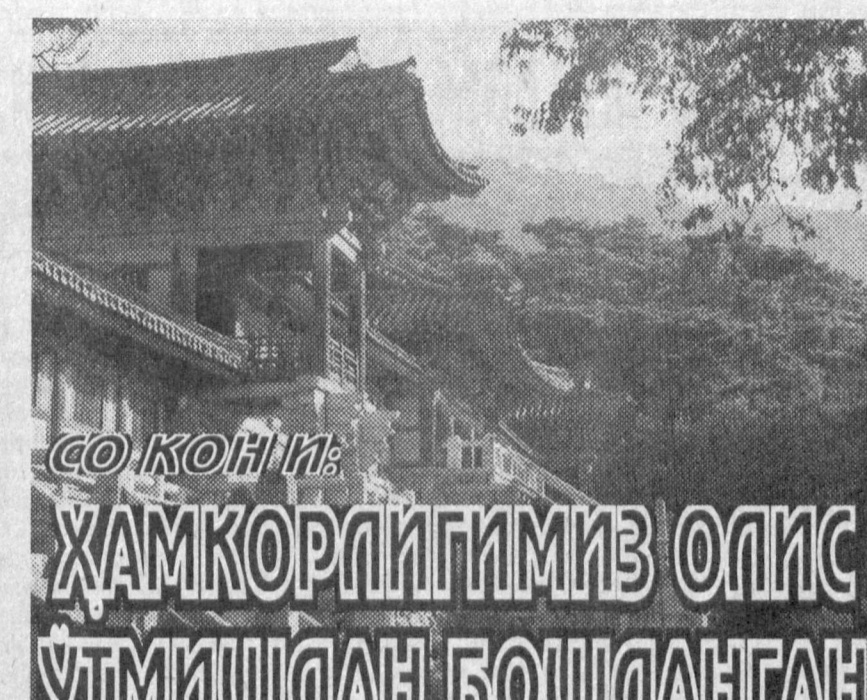
СО КОН И: ҲАМКОРЛИГИМИЗ ОЛИС ЎТМИШДАН БОШЛАНГАН

— Ўзбекистон қисқа фурсатларда жаҳоннинг энг йирик ривожланган мамлакатлари қаторига чиқишининг амалий имкониятига эга бўлган давлатдир. Мамлакатингиз табиий ресурсларга жуда бой. Шунинг ўзи республикангизнинг нималарга қодир эканлигини кўрсатиб турибди. Энг муҳими эса, Ўзбекистонда сиёсий ва иқтисодий соҳаларда ўз олдига пухта ва аниқ мақсадлар қўйган ҳолда уларни босқичма-босқич амалга оширишни режалаштирган. Айниқса, мамлакатингизда миллий валюта ни мустақкамлаш, ҳақиқий рақобат муҳитини шакллантириш, ҳусусийлаштириш жараёнини тезлаштириш ва кичик ҳусусий корхоналар барпо этиш йўлида қилинаётган ишларни алоҳида таъкидлаш лозим. Ҳозирда чет эллардаги етакчи фирма, компания ва йирик саноат корхоналарининг республикангизга бўлган қизиқиши катта. Чунки Ўзбекистонда сармоя киритилишини рағбатлантирадиган ҳуқуқий база мавжуд. Шу боис ҳам мен, ҳолис бир киши сифатида мамлакатингизга кечаётган иқтисодий ислохотларни юсак баҳо-