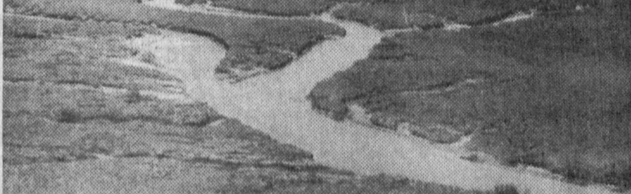
Табиатнинг нодир бойликларини асраш учун миллий дастур зарур

2 миллион гектар ердан маҳрум этиб бормоқда. — Ўзбекистондаги аҳоли қандай? — Бизнинг халқ хўжалигинингизда 28,1 миллион гектар ердан фойдаланилади, бу бутун мамлакат ҳудудининг учдан икки қисмига тенг. Шундан 23 миллион гектари — яйлов (асосан чўллар). Сугориладиган ерлар унча кўп эмас. Бу халқнинг, жамиятнинг катта ва бебаҳо бойлиғидир. Бирок, афсуски, у камайиб борапти. Хўш, нима сабабдан? Қургўқчил минтақаларимиздаги иқлим шароити ва устига-устак одамларнинг масъулиятсизларча пала-партиш фаолияти бунга зомин бўлапти. Оқибатда ер эрозияга учрамоқда, шўрланмоқда, яйловлар танназулга юз тутмоқда.