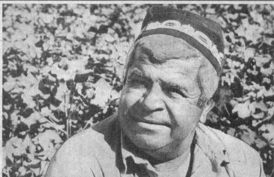
Бугунги кунда Қизилтепа туман пахтазорларида иш қилиш. Маъжуд 9 минг 245 гектар хўжалиқларнинг барчасида гўзал чиллик ниҳосига етказилди. Шунингдек, юқорида санаб ўтилган маъжуд хўжалиқларнинг барчасида гўзал чиллик ниҳосига етказилди.

Тошкентда Ўзбекистон Республикаси Истиқболни белгилаш ва статистика давлат қўмитаси ҳайъатининг кенгайтирилган мажлиси бўлиб ўтди. Унда республика Президентининг Ислам Каримов Вазирлар Маҳкамасининг 29 июлдаги мажлисида ўртага қўйган вазифалар муҳофизат қилинди. Хайъат мажлисида Қорақалпоғистон Республикаси Истиқболни белгилаш ва статистика қўмитасининг, Тошкент шаҳри ва вилоятлар истиқболни белгилаш ва статистика бош бошқармаларининг, туманлар ва шаҳарлар иқтисодий ташкилотларининг мувофиқлаштириш ва статистика бўлимла-