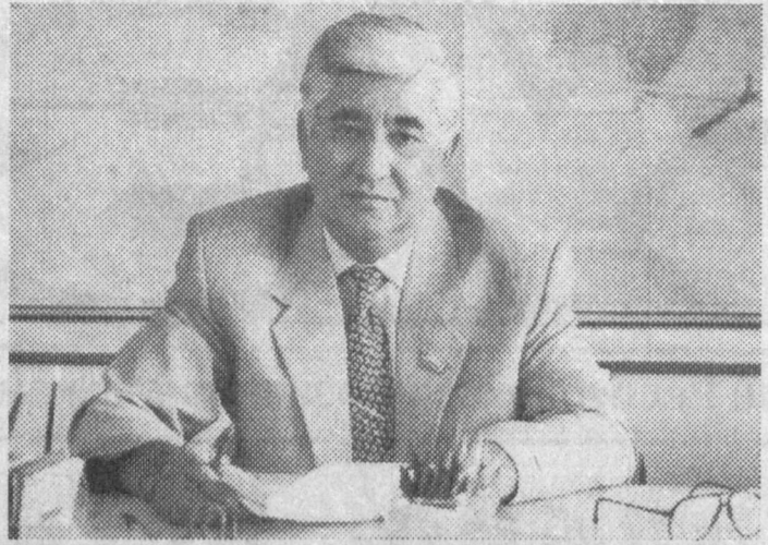
Олий Мажлис Котибияти раиси Омон Ҳамидович ОЛИМЖОНОВ

— Муғлақо. Барча қонунчилик масалалари, ишга таълуқли масалаларни кўриб чиқиш ва