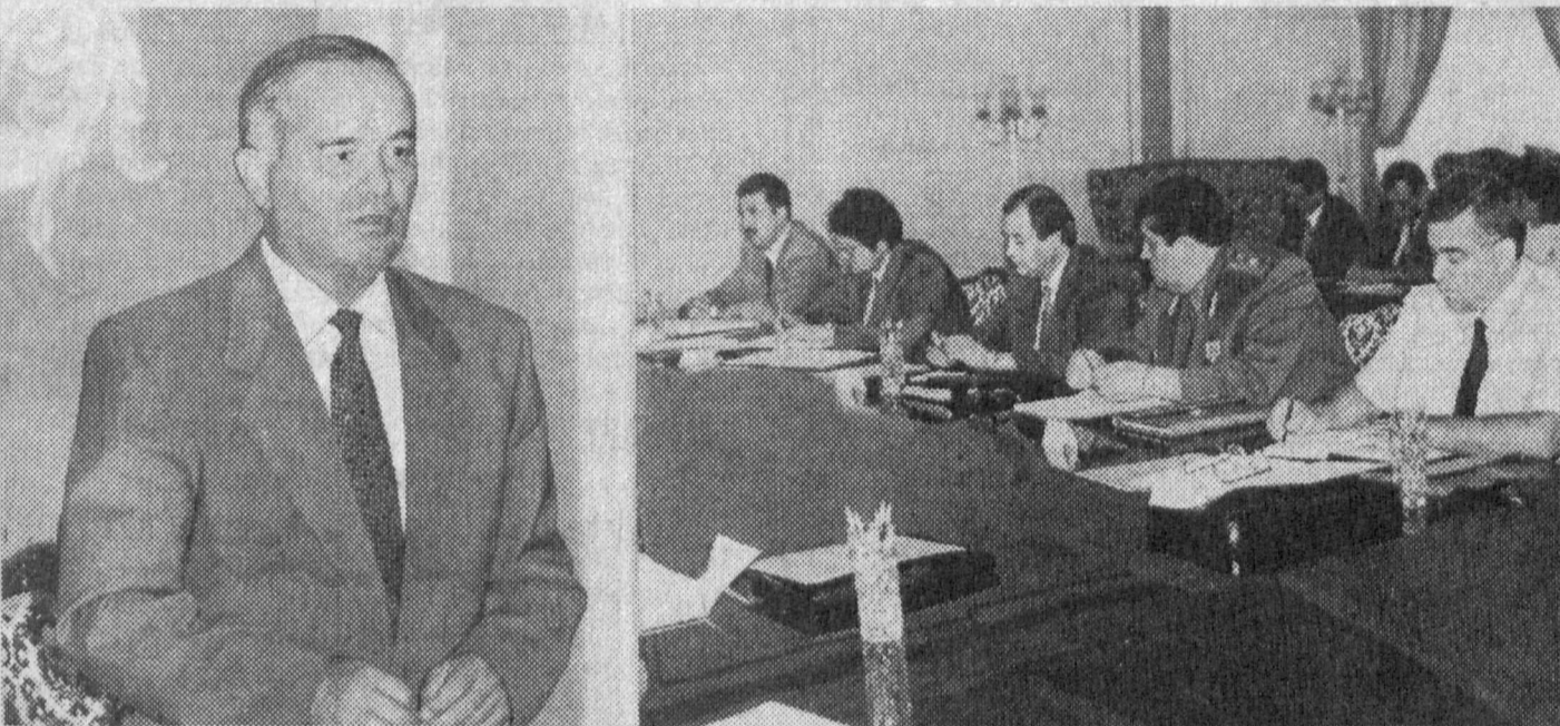
СУРАТДА: мажлис пайти.