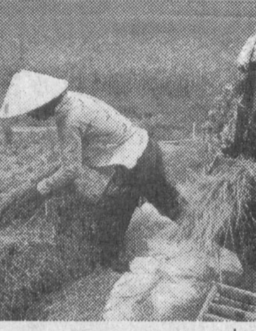
давлат сифатида қарор топиши учун Индонезия халқини яна бир неча йиллар мобайнида инглизлар ва голландларга