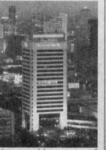
Фурқат САНАЕВ, «Халқ сўзи» мухбири.