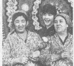
Дилбар ҒУЛОМОВА, Республика Бош вазирининг ўринбосари, Ўзбекистон хотин-қизлар қўмитаси раиси.

қабул қилган «Ўзбекистон Республикаси давлат ва ижтимоий қурилишида хотин-қизларнинг ролини ошириш чора-тадбирлари тўғрисида»ги Фармони аёлларимизнинг жамиятда тўғри қўйилган ва ишбилармонлик катта эътибор берилганлиги билан таъдилди. Бунинг маъноси шунки, ўзбекистонлик аёлларнинг ҳар бирини давлат ва ижтимоий қурилишда фаол иштирок этишга қўлдоғи бўлиши керак.