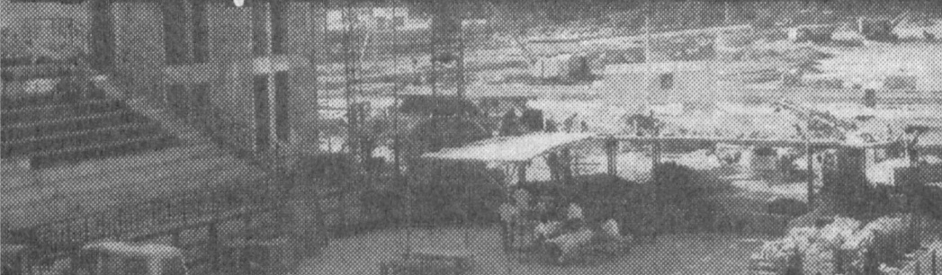
ёки андижонликлар барпо этаётган теннис кортидан репортаж

ри томонидан махсус тайёр-лаб жўнатилган. Ёки Эрон, Исроил каби теннис бўйича тажрибали мутахассисларга эга бўлган йирик давлатлар-да ишлаб чиқарилган энг за-монавий спорт анжомлари ва корт жиҳозларининг ҳам бу ерда кенг қўлланилиши, теннис майдонининг халқ-ро меъёрларга тўла жавоб беришидан далолат бериб турибди. Бир-биридан чи-ройли қилиб безатилган сау-на, прессбар, массаж, дам олиш каби хоналар тўғри-сида ҳар қанча гапирсангиз оз. Улар бетакрор деворий шакл ва шарқона безаклар-