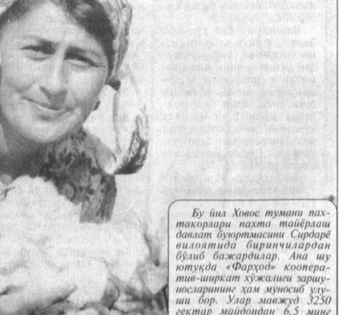
Бу йил Ховос тумани пахтакорлари пахта таёйёрлашда давлат дўртамасини Сардор ёвлятида бириктирилган бўлиб бажаришди. Ана шу ютуқда «Фарҳод» кооператив-ширкат ҳужаки зару-носларининг ҳам муносиб ҳу-шси бор. Улар маъжуд 3250 гектар майдондан 6,5 минг тоннадан зиёд «оқ олтин» иштиштириб олиб, бешайтаст маррадан анча узиб кетишди.

Вилоят пахтакорлари умумий ҳосилини 300 минг тоннага етказишга аҳд қилишган. Бунинг учун барча имкониятлар бори.