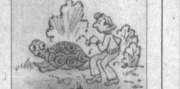
САККИЗ СОАТДА 150 МЕТР

Дунёдаги энг кекса ер ости йўли Европада, аниқроғи Франциянинг Тулон шаҳрида бўлиб, 1681 йили қазилган ва ҳозирги кунгача ушдан фойдаланиб келинади. Бу лаҳмининг узунлиги 197, эни 11, баландлиги эса 10 метрлир. Қизғия нуздаки, у шу пайтгача бирор марта ҳақ таъмирланмаган, яъни бунга ахтиёж сезилмаган.