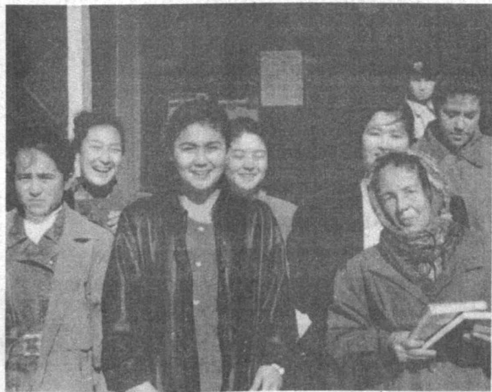
Эртага сайловлар куни. Бу кутлуғ арафа олдидан барча жойларда бўзгани каби Олий Мажлисга сайлов ўтказувчи 80-Нурота сайлов округи ҳам ҳар қачонидан гавжум. Сайловчилар номзодларнинг таржимани ҳоли билан яқиндан танишгани келса, сайлов комиссияси аъзолари эса ушбу сийсий тадбир билан боғлиқ ишларни поёнга етказиш ҳаракатида.