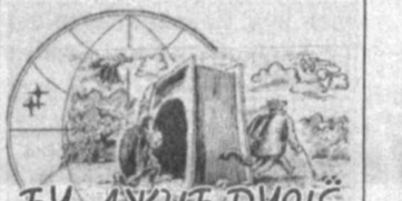
Бу ажиб дуаё