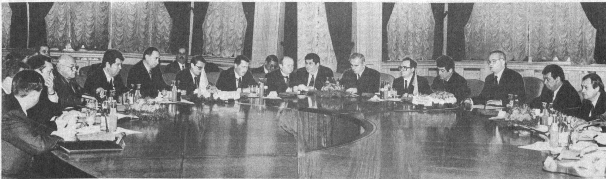
Ўзбекистон Республикаси Президентини Ислам Каримов тақдирини Россия Федерацияси ҳукумати раиси Владимир Путин 10-11 декабр кунлари расмий ташриф билан мамлакатимизда меҳмон бўлди.

Ташрифнинг асосий ва муҳим қисми Дўрмон қароргоҳида бўлиб ўтди. Давлатимиз раҳбари Ислам Каримов ҳамда Владимир Путин икки кунлик ишчи гуҳурурида муносабатларнинг бугунги аҳволи ва истиқболлари тўғрисида фикр алмашди. Иқтисодий ҳамкорлик даражасини ўртақлаштириш борасида олиб-қилинган иш-амалларни муҳофаза қилиш, аммом муҳим факт бўлган, эмас. Мамлакатнинг иқтисодий тараққиёти молия, савдо-сотик, махсулот ишлаб чиқариш тизими қандай йўлга қўйилгани, бундаги илгор давлатлар билан қай даражада шериклик қилишга боғлиқ. Шундай экан, хори-