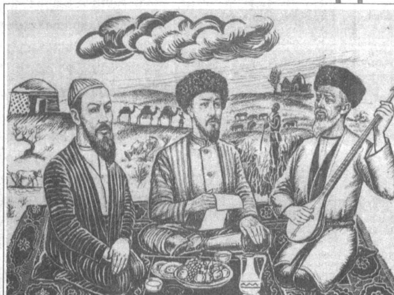
Қорақалпоқ халқининг фахр этса арзийдиган шоирлари, бахшилари, олим фозиллари бор. Таниқли мусавир Маҳмуд Жура ўғлининг қаламига мансуб ушбу суратда қорақалпоқ халқининг буюк шоирлари Ажиниёз (чапдан) Бердах ва Қўсибойлар сиймоси акс этган.

да эътироф этади, хатто ингуш, нўғой, ёқутлар ҳақида, Москов, Қозон, Уфа, Оренбург хусусида ўз фикрларини баён қилади.