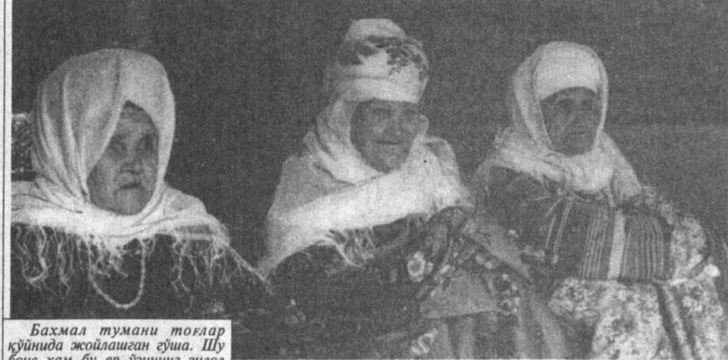
Бахмал тумани тоғлар қўйида жойлашган сўма. Шу боис ҳам бу ер ўзининг зилол суварлиро минг дардга даво доғирор гиёҳлари билан барчани ром қилиб келади.