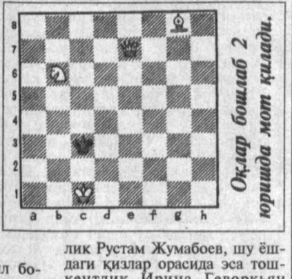
Оқлар бошқаб 2 юришда мот қилади.

тўртинчисидан эса 200 нафар шахматчи қатнашди. У йилдан йилга оммалашиб бормоқда. Бу гал қатнашчилар сафида республикамизнинг деярли барча вилоятлари, қарош Қозғистоннинг Чимкент, Жамбул ва Олмоғот шаҳарларидан вакиллар иштирок этишди. Улар орасида ёшлар халқаро турнирлари, Осиё биринчиликларининг совриндорлари ҳам бўлишди. Бу борида кўпчиликнинг баҳаси бўлиб қолган эди. Тўртинчи халқаро болалар мафтўнкор баҳаслар оқибатида