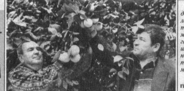
Тошкент туманидаги «Мева-шарбат» бод-дорчилик, узумчилик ва виночилик илмий-иш-лаб чиқариш корпорациясига қарашли бир ге-ктарлик иссиқхонада шўрус мевалари — ли-мон, апельсин ва мандарин тарқ шўди. Бри-гада бошлиғи Зикрилла Кўчқоровнинг айти-шича, ҳўзирга қадар 13 тонна иссиқхона не-матлари пойтахт аҳолиси дастурхонига тор-тиқ этилган. Янаги илганича яна 5 тонна мева савдо шўхобчаларига чиқарилади.