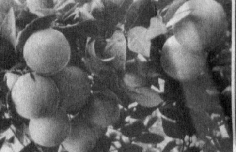
ИССИҚХОНА НЕЪМАТЛАРИ — ЭЛ ДАСТУРХОНИГА