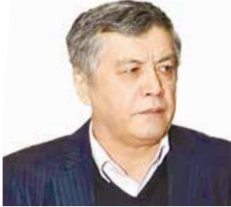
Nisbatan qisqa ushbu she'rda ruhiyatning tushkun lahzalaridagi g'amgin holat, dard ifodalangan. She'r yakunida-gi ketmoqning muhabbatga o'xshatilishi nihoyatda betakror bo'lib, bahsga hojat qoldirmas darajada quyma satrni yuzaga keltiradi. Haqiqatan ham, muhabbat qaytmas tuyg'u, bu xalqimizda “qolgan ko'ngil topilmas”, deya e'tirof etiladi.

1979-yil ilk to'plamini nashr ettirgan-da Xurshid Davron yigirma yetti yoshda edi. To'plamga kiritilgan namunalar chop etilishidan avvalroq yozilganligini nazarda tutsak, she'rlar tahlilida lirik qahramon va uning kechinmalarini aniqroq his qilish, talqin eta olamiz. Shoirning ilk to'plamidagi she'rlari badiiyatini ko'rsatib turuvchi asosiy belgi - ma'sumiyat va samimiylik. Uning to'plamga kiritilgan aksariyat she'rlarida bolalikni qo'mash o'z ifodasini topgan.