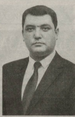
Шерзод РАҲИМОВ, Олий Мажлис Қонунчилик палатаси депутаты, «Миллий тикла-ниш» демократик партияси фракцияси аъзоси

Мазкур қарор ёшлар ва хотин-қизлар, меҳнат бозорига энди кириб келаётган битирувчиларни иш билан таъминлашда муҳим аҳамият касб этиши шубҳасиз. Халқ вакиллари – биз депутатларнинг вазифаси эса жойларда ушбу қарорнинг мазмун-моҳиятини кенг тарғиб қилиб, жойларда унинг ижросини назорат қилишдир.