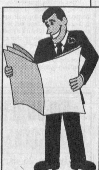
«Бу муваффақият сари йўлдир»

Агар Сизда самарадор лойиҳавий фикр ва уни амалга ошириш учун эркин валютада кредит керак бўлса, Миллий Банк қошида махсус тузилган бўлим лойиҳангизнинг режасини тайёрлашда, бизнесрежа ишлаб чиқишда ва лойиҳанинг оптимал таъминот схемасини танлашда ёрдам кўрсатади.