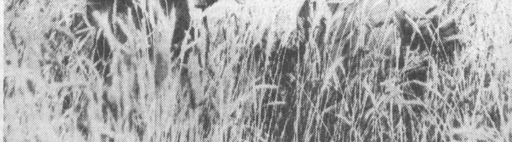
Сугорилдиган ва лалми ерларда кузги бошоқли дон экинларидан мўл ва сифатли ҳосил олиш омиллари

таркибли туپроқларда эса 1500-2500 куб метр ва ундан ҳам орттиқ бўлиши лозим. Тупроғи физик етилган ерларни дарҳол 25-27 см. чуқурликда агдариб қўйиб, сўнгра П-8, ГН-4 ва бошқа мосламалар ёрдамида плуг излари, дала четлари яхшилаб текисланиши лозим. Шундан сўнг гектарига 15-20 тонна маҳаллий, 80-100 килограмм фосфорли, 50-60 килограмм калийли ўғитлар РОУ-6 ва НРУ-0,5 механизмлари ёрдамида сепилиши зарур. Экин олдиндан нам туллаш ҚЧУ-4 чизел-култиватор ёки ЛДГ-10 ёки БДТ-3, БДТ-7 дискли бороналар билан ишланиши, сўнгра туپроқдаги намликни сақлаш ва уни енгил зичлаш учун мола босилиши тавсия этилади.