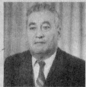
Бурғатали РАПИҚАЛИЕВ, Наманган вилояти ҳокими, Ўзбекистон Республикаси Олий Мажлиси депутаты.